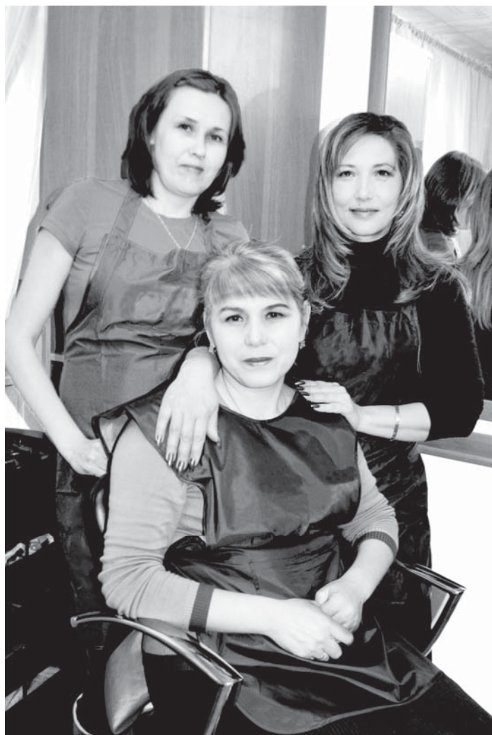
Специалисты салона «Гармония» (ИП С. Магомедалиева)

Уже состоялись торжественные проводы зимы и сожжение Масленицы, а это значит, что весна идет, а вместе с ней – с плеч долой теплую одежду. И здесь уже не спрячутся за шапками волосы, за варежками и перчатками – руки. Поэтому специалисты салона «Гармония» напоминают жителям о себе и предлагают различные услуги.