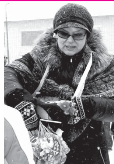
Торговые ряды на празднике

Каждый день Масленицы имеет свое название. Понедельник - «Встреча». Время для гостей и встреч. Вторник - «Заигрыш». День для гуляний и веселья. Среда - «Лакомка». Это день, когда пекут блины, пироги. Четверг - «Разгуляй». День гуляний на вежем воздухе. Пятница - «Вечер у тещи». В этот день теща приглашает зятя на блины. Суббота - «Угощение золовки». В такой день собирается вся семья за столом.