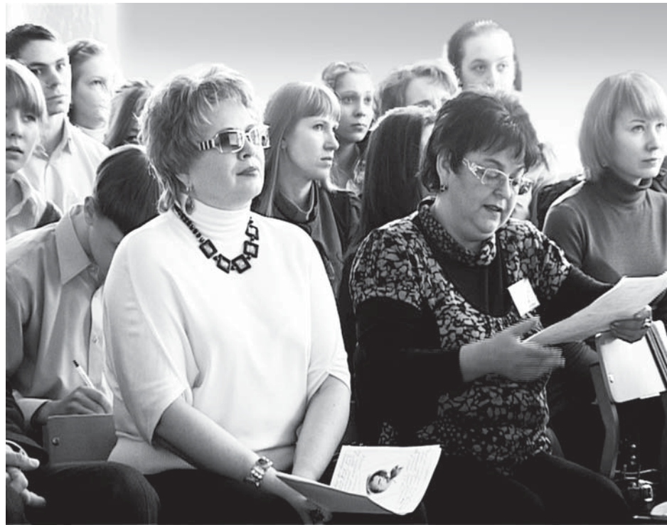
Участники и организаторы XIV научно - практической конференции

Стоит заметить, что за 14 лет сильно изменилась тематика, открылись иные проблемы и подходы в выполнении работ. За это время приняли участие в конференции тысячи учащихся. Как и прежде, с ребятами общаются специалисты высокого уровня Корпорации ВСМПО-АВИСМА, компании «Боинг», доктора наук и доценты Верхнесалдинского филиала УРФУ, заслуженные учителя города.