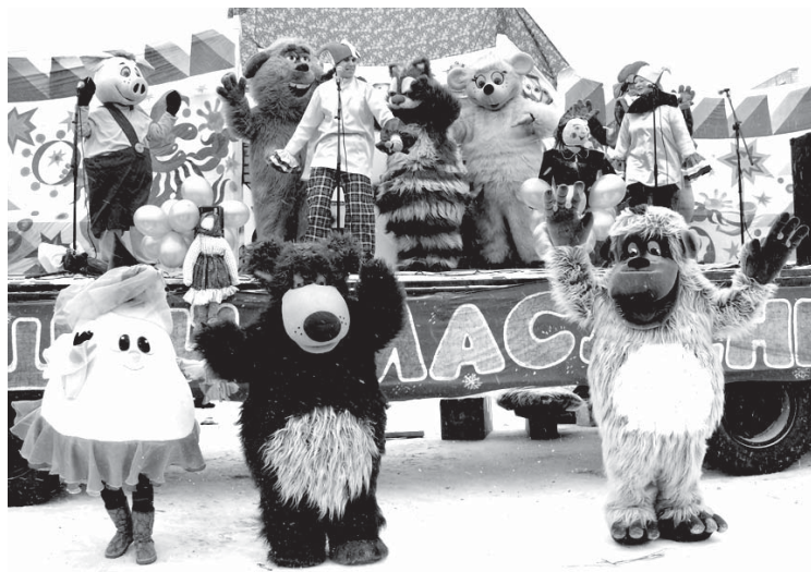
Сказочные персонажи приглашали зрителей принять участие в забавах и конкурсах

С утра, в воскресный день, на площади, у техникума, зазвучала музыка, зазывая народ на праздничное торжество, молодецкие забавы, массовое гуляние. Но немногие горожане пришли попрощаться с Масленицей, проводить зиму. Возможно, не все знали о празднике, так как в прошлом году он не проводился, а тем, кто знал, помешали предшествующие этому дню корпоративные вечеринки, холодная погода. Или пошли в церковь. Ведь именно это воскресенье оказалось «Прощеным», и люди извинялись друг перед другом за причиненные обиды, недоразумения. В Храме в этот день совершали обряд прощения, чтобы человек начал Великий пост с чистой душой и совестью. Как, впрочем, по этой же традиции в этот день всегда сжигают чучело Масленицы и прощаются с уходящей зимой.