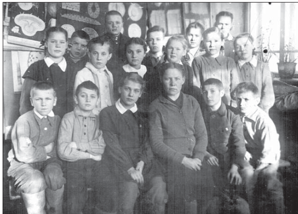
5 класс, 1947 год.

"Довелось и мне там быть И подарок получить - Юбку, желтую такую, Не по возрасту большую... Велика? Чего ж тужить? Шаровары можно сшить. Ничего, что желтый цвет, Да зато теплее нет. Им была я очень рада - Дорога, мила награда... Тяжело жила страна. Что же делать? Шла война!"