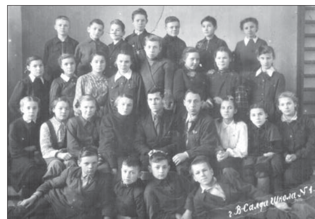
7 класс, 1949 год.