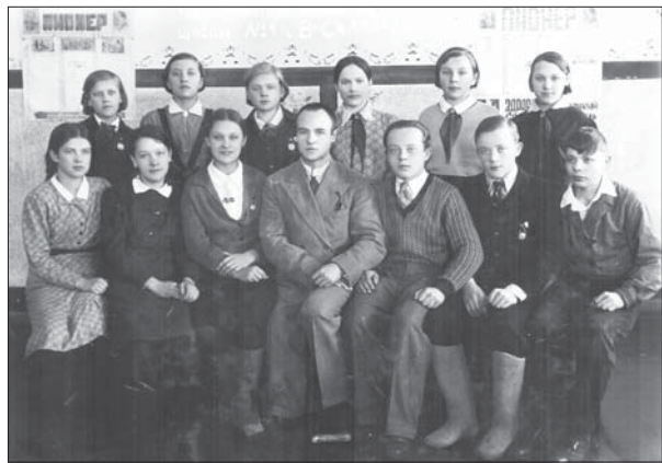
Юннаты. 1941 год.