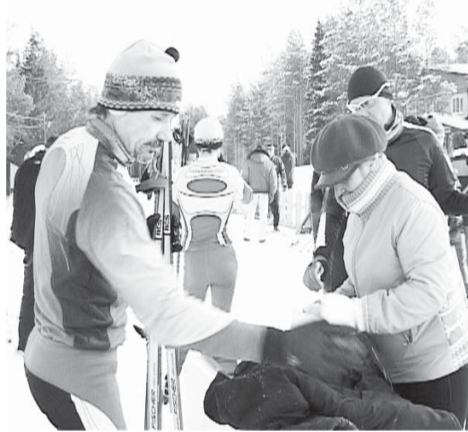
Чаепитие после финиша

29 января состоялась традиционная областная кубковая гонка среди любителей лыжного спорта на призы ФСК ВСМПО «СТАРТ».