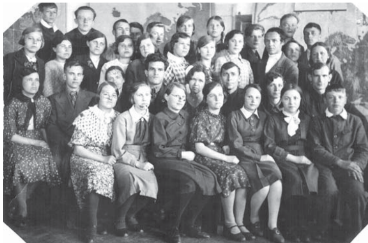
1940 год, 8 класс школы № 14 им.А.С.Пушкина