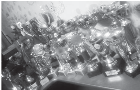
Комната чемпиона украшена кубками спорта. И вот на-