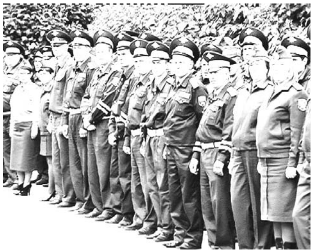
Построение перед смотром

ведена до уровня механического регистратора событий, дежурные части подчинялись секретариатам, численность их сокращена. Лишь спустя три года эти разрушительные «реорганизации» были, наконец, прекращены. В 1986 году инспекторские управления, отделы, отделения, группы союзного, республиканского МВД, ГУВД, УВД преобразовываются в организационно - инспекторские. В их структуры возвращены дежурные части, подразделения информации и анализа, обобщения передового опыта. В крупных ГОРОВД образованы организационно - инспекторские отделения, в остальных - введены должности старших инспекторов и инспекторов по анализу, планированию и контролю. Таким образом, был сделан первый шаг к восстановлению ряда важных штабных функций, воссозданию организационно - инспекторских аппаратов на всех уровнях функционирования органов внутренних дел. В 1996г. в МВД России вновь создан штаб в составе трех управлений: информационно-аналитического, организационно - планового и оперативного (с включением дежурной части МВД), а также главной инспекции (на правах управления) и редакционно - издательского отдела. Таким образом, была завершена организационная работа по созданию системы штабов органов внутренних дел, охватывающей все уровни управления.