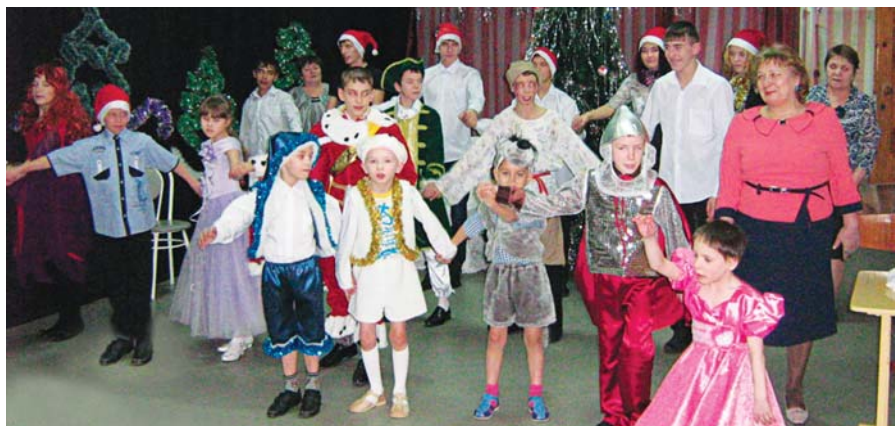
Страницу подготовили Олеся САЛТАНОВА и Евгений МАНУЙЛОВ

Накануне Нового года сотрудники предприятия готовят подарки для воспитанников детского дома. Чтобы сделать приближающийся праздник настоящим чудом, дети пишут письма Деду Морозу. 13-летний Ваня, который приехал в детский дом неделю назад, попросил у новогоднего волшебника телефон, чтобы общаться со своей сестрой, живущей в другом городе. Заветное желание мальчика будет исполнено: совершать маленькие чудеса – это тоже традиция Староцементного завода.