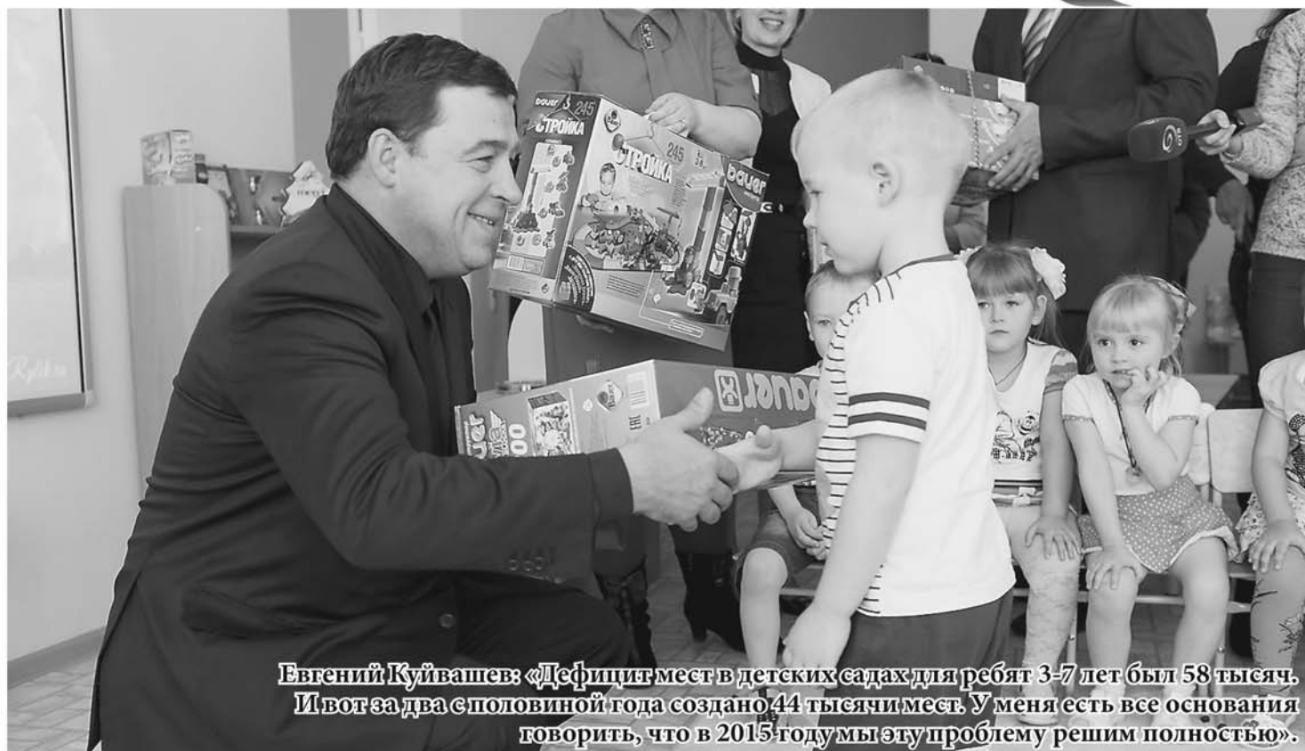
Евгений Куйвашев: «Дефицит мест в детских садах для ребят 3-7 лет был 58 тысяч. И вот за два с половиной года создано 44 тысячи мест. У меня есть все основания говорить, что в 2015 году мы эту проблему решим полностью».

Действительно, Министерство строительства России сегодня разрабатывает программы. И я абсолютно поддерживаю эти начинания, и благодарен федеральным коллегам за то, что они к этой теме подступились. Отдельно взятому субъекту или городу с этой проблемой не справиться. Мы с вами можем построить завод, но для этого нужно подготовить финансовую модель, в том числе и со стороны Федерации: экологические сборы за утилизацию упаковки, бытовой техники и так далее. И то, что сегодня этот вопрос прорабатывается, очень важно.