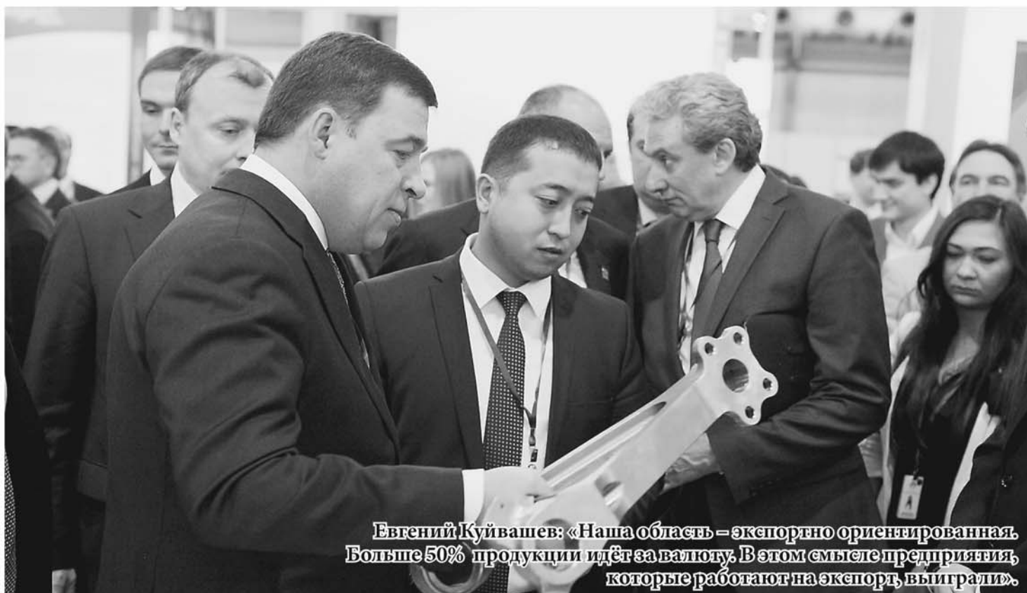
Евгений Куйвашев: «Наша область - экспортно ориентированная. Больше 50% продукции идёт за валюту. В этом смысле предприятия, которые работают на экспорт, выиграли».

- В последние две недели мир особенно интенсивно менялся в связи с валютными курсами. В этой ситуации как себя чувствует Свердловская область, экспортно ориентированные предприятия? И что бы вы пожелали уральцам - вкладываться в квартиры или переждать?