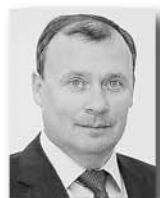
Алексей Орлов, первый вице-премьер – министр инвестиций и развития Свердловской области:

В областной фонд поддержки предпринимательства поступило свыше двух тысяч заявок на предоставление средств. На финансовую поддержку 700 субъектов предпринимательской деятельности было направлено 912,4 миллиона рублей. Субсидии направлялись на модернизацию, на уплату первого платежа по лизингу.