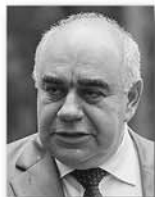
Аркадий Белявский, министр здравоохранения Свердловской области:

«Мы смещаем акцент с оказания медицинской помощи в круглосуточных стационарах на поликлиническую и амбулаторную помощь. В результате всех преобразований: оптимизации сети учреждений, внедрения эффективных контрактов удалось сэкономить 558 миллионов рублей, которые были направлены на повышение заработной платы медицинским работникам».