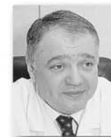
Ян Габинский, директор Уральского института кардиологии, академик:

сти. В этой связи предлагаю объявить 2015 год Национальным годом борьбы с сердечно-сосудистыми заболеваниями, которые являются основной причиной смертности сегодня.»