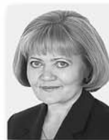
Людмила Бабушкина, председатель Законодательного Собрания Свердловской области:

«Надо максимально снять ограничения с бизнеса. На ближайшие четыре года «зафиксировать» действующие налоговые условия. Для малых предприятий, которые регистрируются впервые, будут предоставлены двухлетние «налоговые каникулы». Также льготы получат производители, начинающиеся с «нуля.»