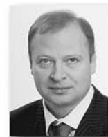
Виктор Шептий, секретарь СРО партии «Единая Россия», зампредседателя Заксобрания Свердловской области:

вращающихся в Россию. Если человек легализует свои средства и имущество в России, он получит твёрдые правовые гарантии, что его не будут таскать по различным органам, в том числе и правоохранительным.»