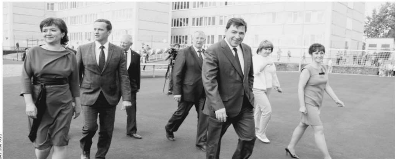
Евгений Куйвашев: «Многое удалось сделать в рамках реализации «майских» указов Президента Российской Федерации, но мы понимаем, что наши врачи, учителя должны получать больше. Мы уже продумываем пакет предложений по этой проблеме».

Создавая надёжную экономическую базу, мы будем поднимать уровень жизни. Прежде всего, внимание будет обращено на представителей старшего поколения. В программе прописано положение о том, что будет принят закон об обязательной индексации пенсий, и мы это сделаем! Буквально на днях Президент России на встрече с лидером российских профсоюзов высказался о том, чтобы ввести порядок, при котором выплата заработной платы имеет приоритет над уплатой налогов. Это принципиальный момент. За достойный труд человек должен получать достойную и своевременную зарплату.