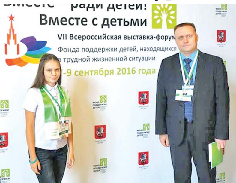
Перед началом выставки-форума – фотосессия у центрального стенда

В работе выставки участвовали более 1000 человек. Тех, кто представлял свой опыт в решении обозначенных проблем и подготовил свои тематические выставки, было шестьдесят: 11 – из муниципалитетов, в том числе и я, остальные 49 представляли регионы и города-миллионники.