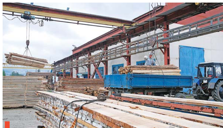
Производственный участок лесхоза

50-летний опыт Сухоложского лесхоза мог бы послужить на благо развития лесов области, но пока идея о научно-производственном учреждении так и остается идеей.