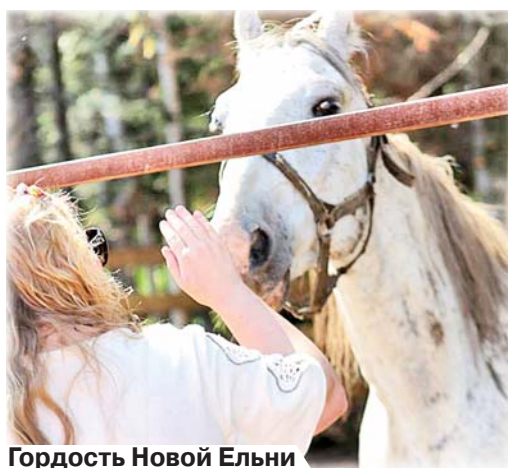
Гордость Новой Ельни