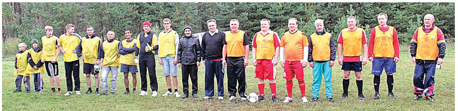
Страницу подготовила Ольга ДЕМИНА

На снимках: на обед будут борщ и пельмени; футбольные команды.