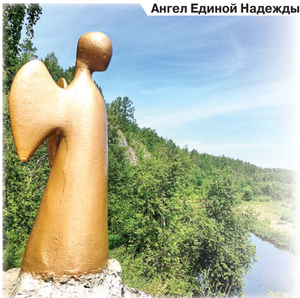
Ангел Единой Надежды