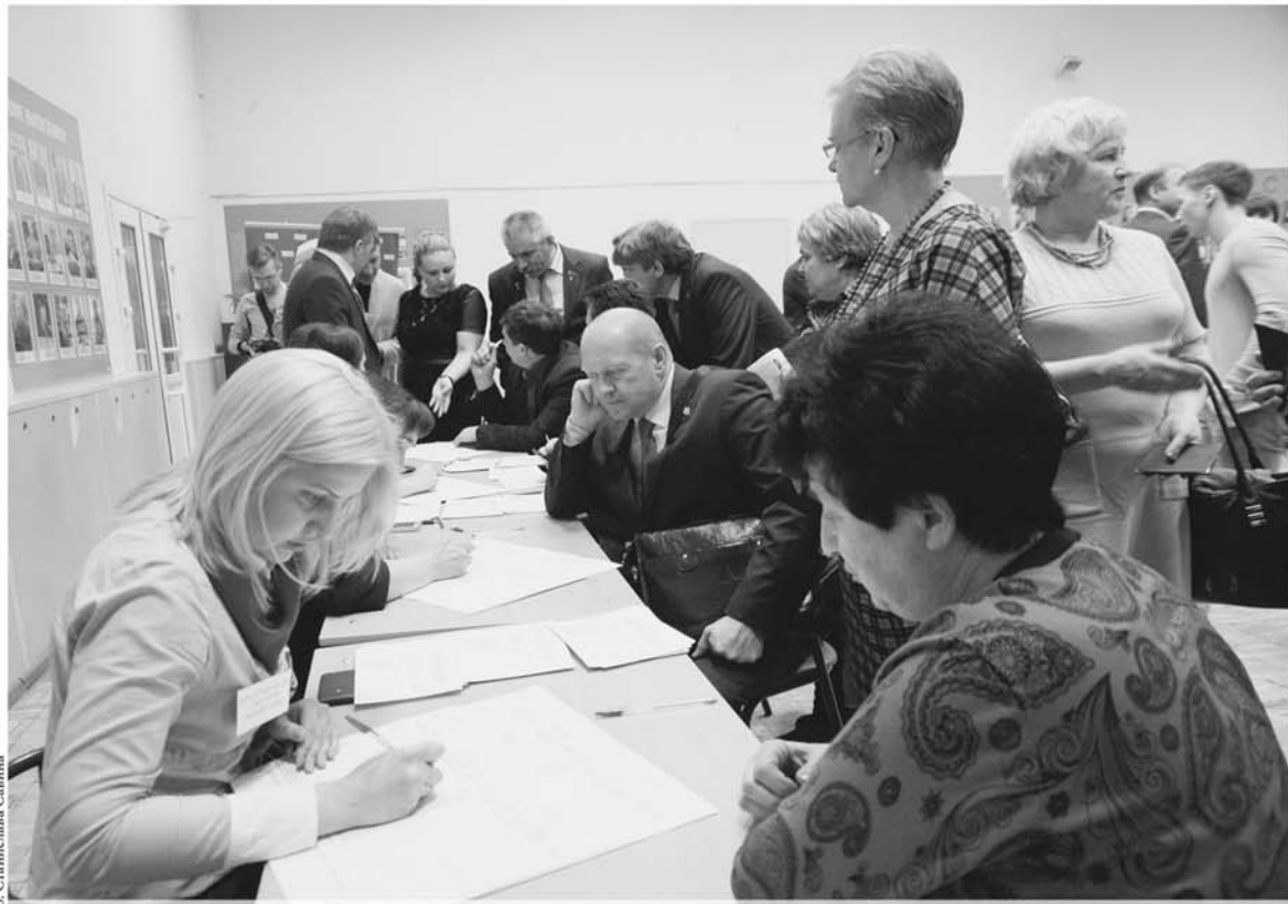
Есть мнение, что в перспективе такое предварительное голосование станет традиционным.