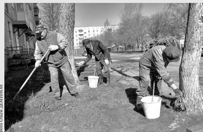
Дворники наводят порядок в юго-западном микрорайоне