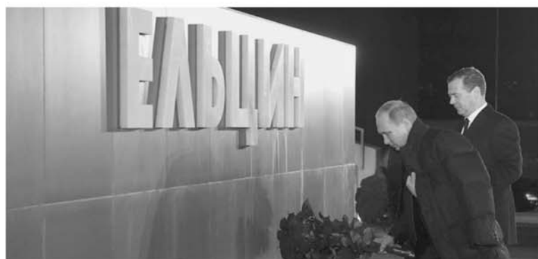
Владимир Путин и Дмитрий Медведев возложили цветы к памятнику первому российскому Президенту.