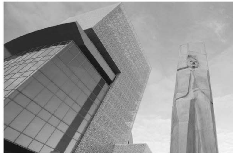
Работы по созданию центра велись с 2011 года. Сейчас это пятиэтажное здание многофункциональной направленности.