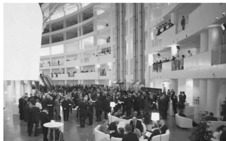
В центре будет библиотека, собрание архивных документов и площадка для открытых мероприятий, конференций, встреч.