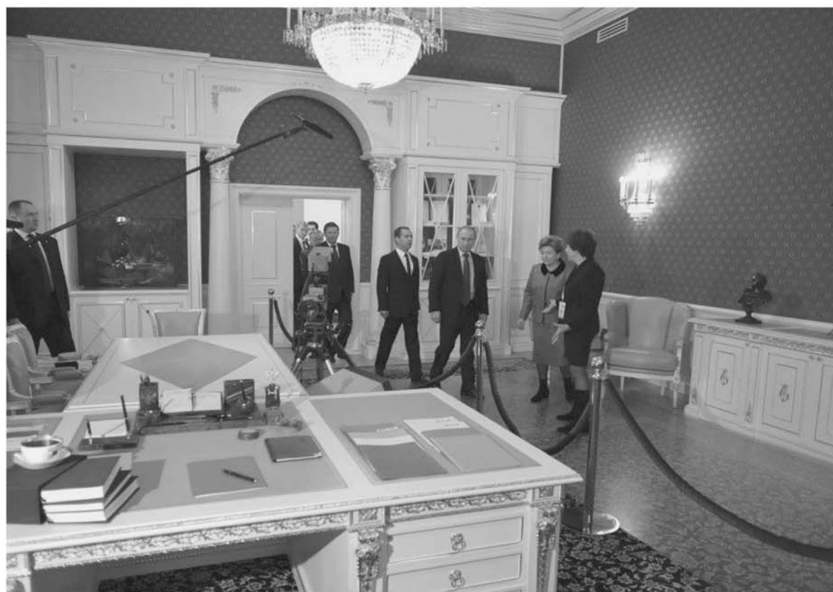
Самый удивительный экспонат – рабочий кабинет первого Президента России, обстановка которого – от письменного стола до штандарта – перенесена из Кремля в музейное пространство.