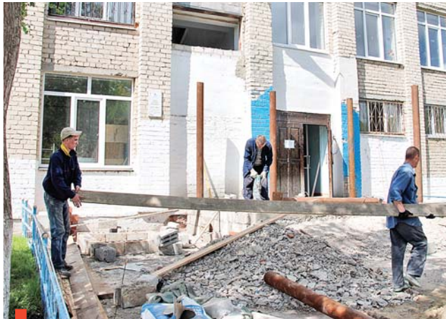
Школьное крыльцо изменится до неузнаваемости

крыльцо с ажурной кирпичной кладкой, которое было визитной карточкой здания, полностью демонтировано. Заново будут выложены ступеньки, на металлические опоры установят козырек. Лест-