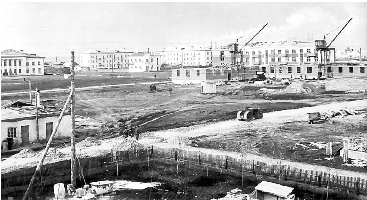
2. Сухой Лог. Строительство дома №5 по ул. Кирова, 1960-е годы

Подготовила к печати Маргарита ПИДЖАКОВА