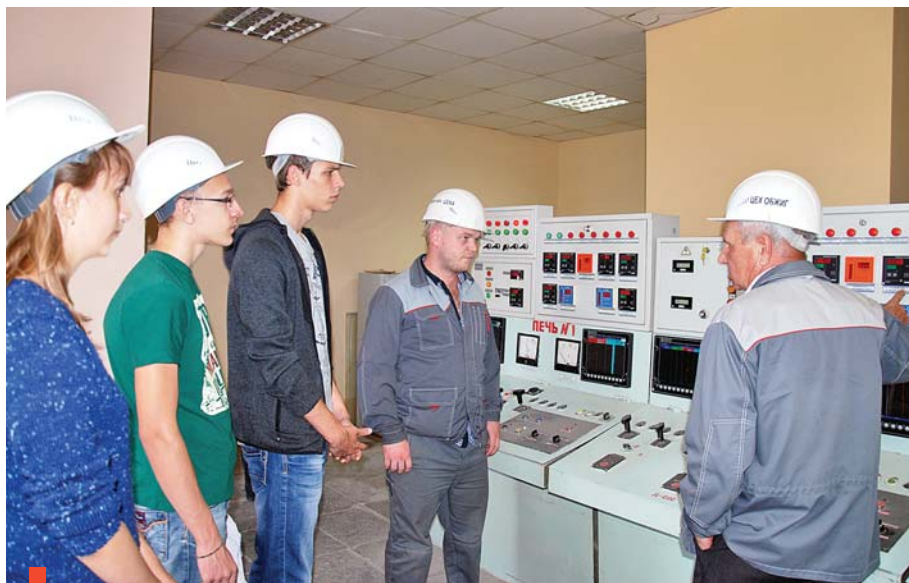
В пультовой цеха «Обжиг»

На современном предприятии сосредоточено множество разнообразных контрольно-измерительных приборов, датчиков, анализаторов, регуляторов и другой автоматической аппаратуры. От достоверности поступающей с этих приборов информации зависит соблюдение технологии и качество выпускаемой продукции. Для монтажа, наладки, последующей эксплуатации или ремонта сложной аппаратуры необходимы высококвалифицированные рабочие, обладающие знаниями и практическим опытом. Такими специалистами являются слесари по контрольно-измерительным приборам и автоматике (КИПиА). С этой профессией нам сегодня и предстоит познакомиться.