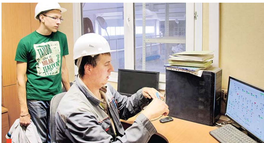
Автоматическая система управления линией сухих смесей

Студенты получают теоретические и практические знания по технической механике, электротехнике и электронике, метрологии, материаловедению.