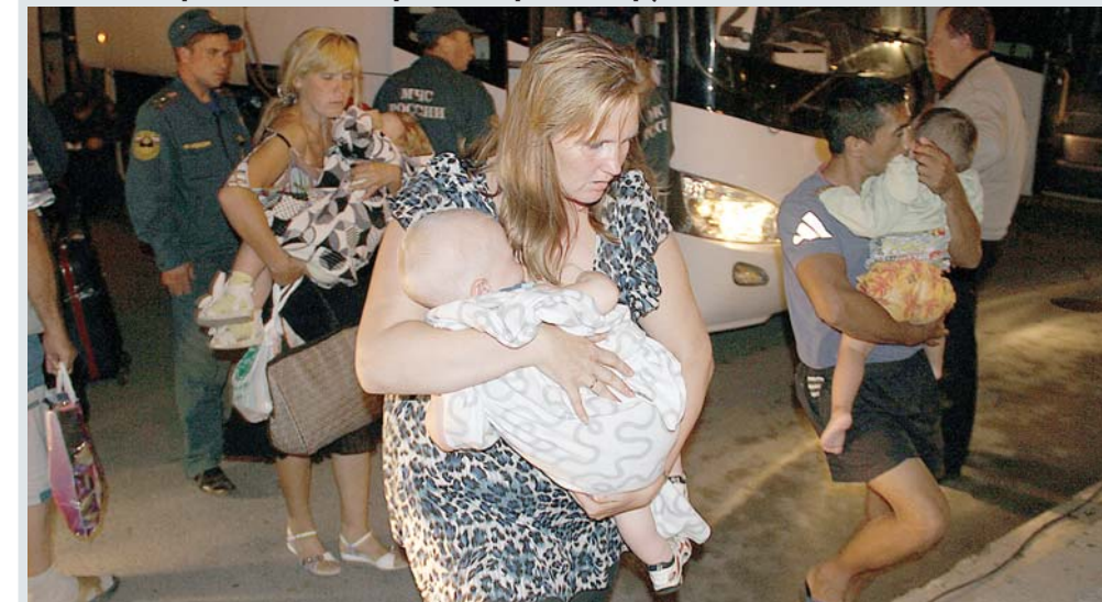
Как живут в Сухом Логу люди, бежавшие от войны? С какими проблемами сталкиваются? С какой страной связывают своё будущее — об этом в нашем материале.

Приехавших поселили в пункте временного размещения (ПВР) Сухого Лога. Однако это были не первые граждане Украины, пострадавшие от военных действий. Еще в начале лета люди стали приезжать самостоятельно. Начиная с июня 2014 года на суходоложской земле нашли убежище 334 человека, из них половина приехала к нам при поддержке сотрудников МЧС.