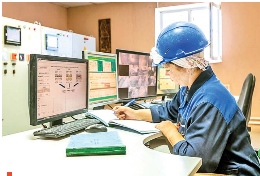
Данные с приборов систематизируются компьютерной программой

Слесарь по КИПиА имеет дело с быстро усложняющейся и совершенствующейся техникой, что требует от него постоянного профессионального роста. Представители этой профессии нередко становятся активными рационализаторами и изобретателями.