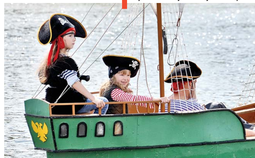
Пиратская шхуна «Колумб» В. Ефанова