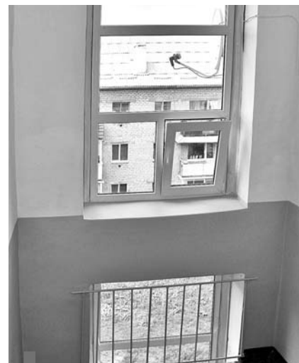
Новые пластиковые стеклопакеты и ремонт в подъездах дома №3А по пр. Строителей

В то же время собственники дома №3А по проезду Строителей, заботясь об общедомовом имуществе, на общем собрании приняли решение установить пластиковые окна в местах общего пользования и отремонтировать подъезды. На окна хватило денег, собранных на счете дома в прошлые годы, за ремонт подъездов жителям начисляют дополнительные средства. Примечательно то, что жители сами выбрали подрядчика работ, а УК от имени жильцов заключила с ним договор. На будущий сезон владельцы квартир планируют собрать деньги на ре-