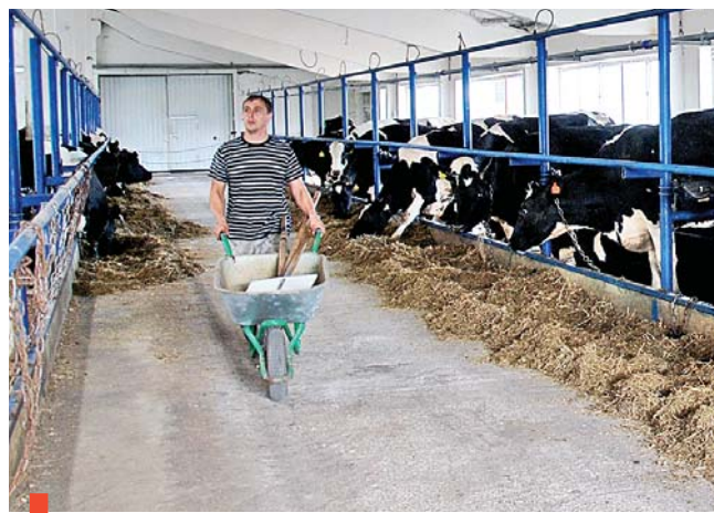
На филатовской ферме теперь просторно и комфортно

Сбалансированные корма и грамотная система кормления уже принесли первые результаты. Если еще пару месяцев назад удой от одной коровы составлял 10–11 литров в сутки, то сегодня он увеличился до 18 литров. Стабильную динамику можно прогнозировать и по результатам