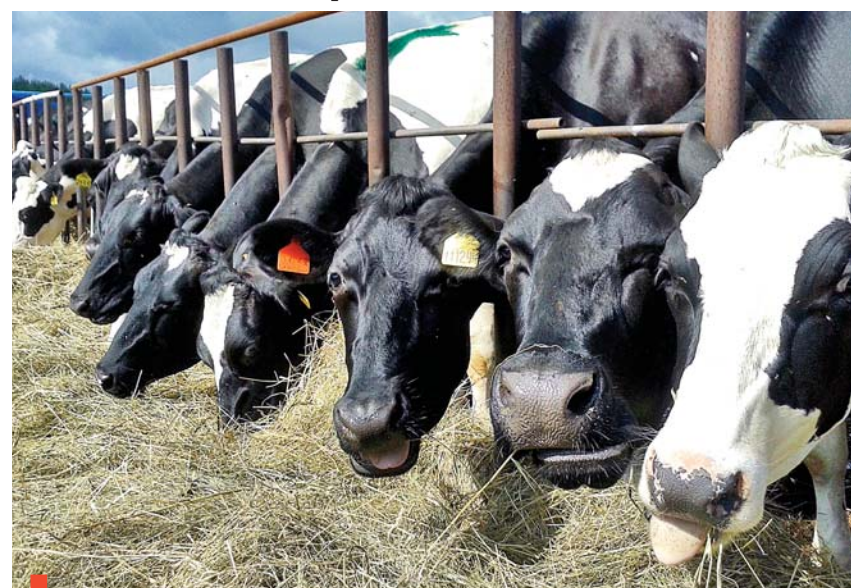
Племенные новопышминские бурёнки черно-пестрой породы

Новый статус позволит увеличить производство животных и принесет дополнительную государственную поддержку на племенное стадо.