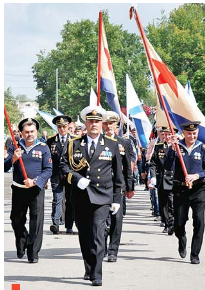
Чеканным шагом по Центральной площади Суходога