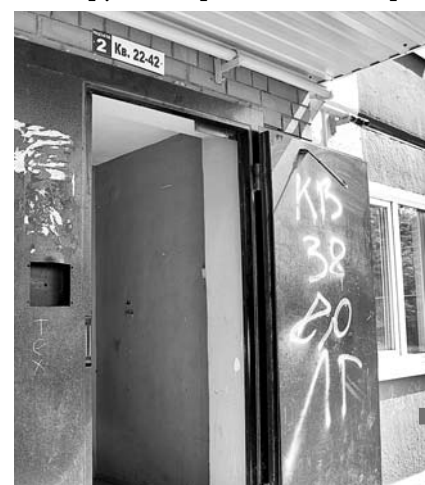
Сломанный домофон, выбитые стекла, мусор в подъезде дома №10Б по ул. Фучика