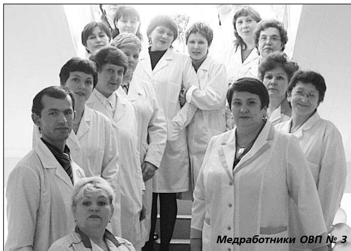
Медработники ОВП № 3

День медицинского работника – это повод еще раз сказать слова благодарности тем, в чьих руках наше здоровье, а порой и жизнь. Напомним читателям, что 2012 год – для кушвинского здравоохранения особенный – сразу несколько юбилеев приходится на него: 90 лет создания инфекционной службы в г. Кушве, 50 лет отмечает отделение скорой медицинской помощи; 50 лет со дня открытия поликлинического отделения медсанчасти ГБУ (ныне ОВП № 3); 15 лет со дня открытия нового хирургического корпуса ЦГБ и 10 лет создания музея истории кушвинского здравоохранения.