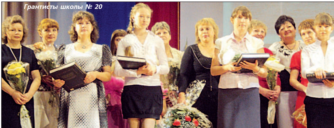
Грантисты школы № 20

Каждый год с приходом лета в городе проходит этот замечательный праздник, венчающий труд лучших учеников, учителей и родителей за все годы учебы. Это первый выпуск длиной в 11 лет. Когда выпускники поднялись на сцену, всем едва хватило места. Это тот случай, когда чем больше – тем лучше.