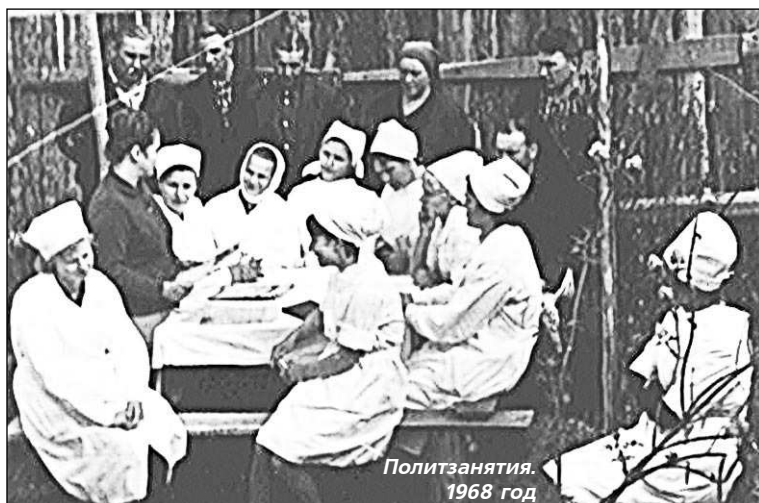
Политзанятия. 1968 год