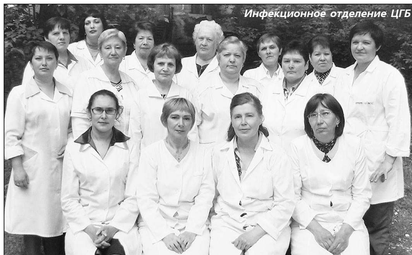
Инфекционное отделение ЦГБ