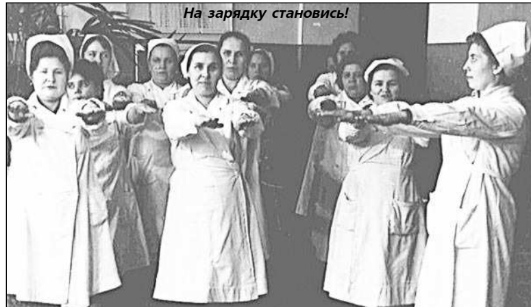
На зарядку становись!