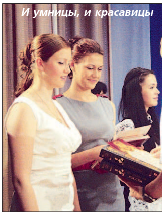
И умницы, и красавицы

В СУББОТУ, 16 июня, во Дворце культуры состоялся городской праздник "Молодежные горизонты", посвященный Дню молодежи и окончанию очередного учебного года. В 12-й раз город чествовал свою лучшую молодежь за успехи в учебе и общественной жизни.