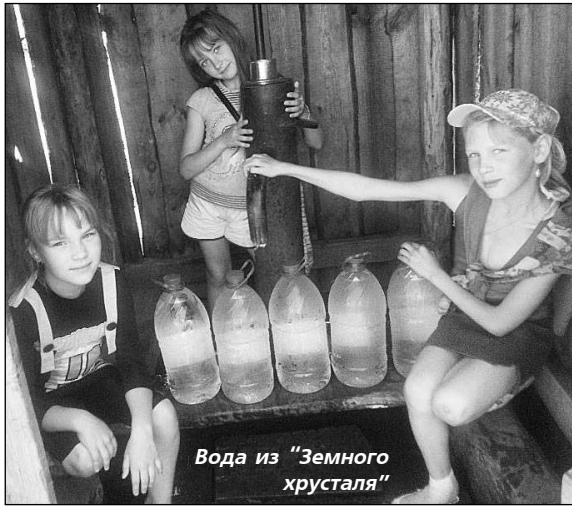
Вода из "Земного хрустала"

Из 87 детско-юношеских коллективов Горнозаводского округа объединение "Малахитовая шкатулка" в 2012 году наградили дипломом за первое место в конкурсе на лучшую реализацию государственного правительственного областного проекта "Родники".