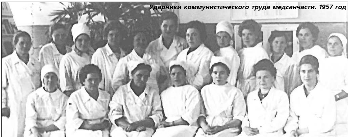
Ударники коммунистического труда медсанчасти. 1957 год