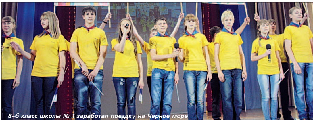
8-6 класс школы № 1 заработал поездку на Черное море