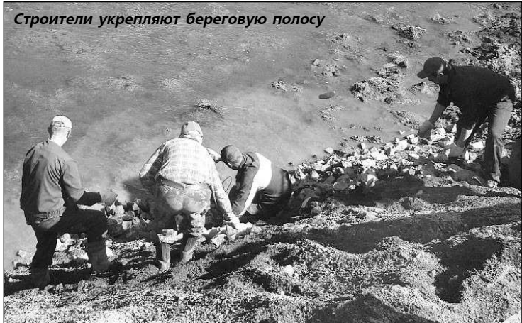
Строители укрепляют береговую полосу