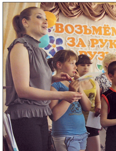
Подводим итоги года