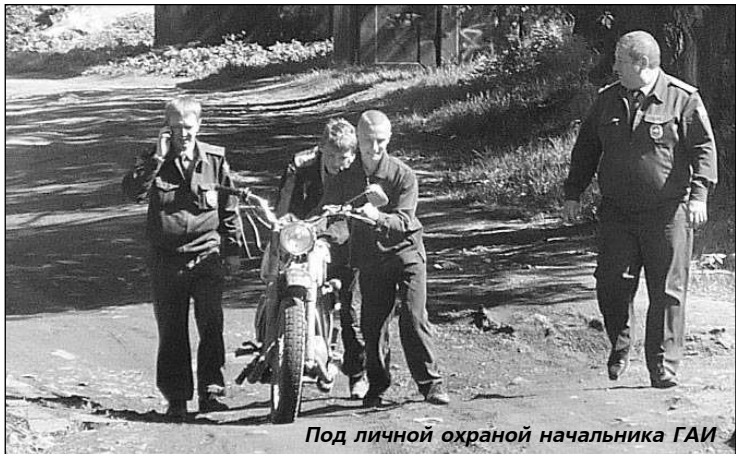
Под личной охраной начальника ГАИ