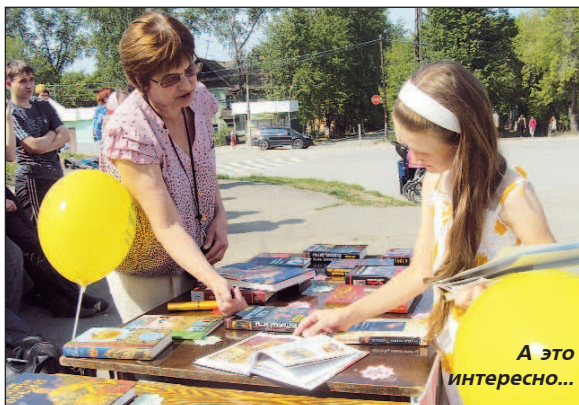
А это интересно...

По сложившейся традиции в первый день лета и в Международный день защиты детей на площадке Культуры состоялся VI городской фестиваль "Да здравствует Кушва читающая!". Его организаторами стали управление культуры, Библиотечно-информационный центр, управление образования Кушвинского городского округа.