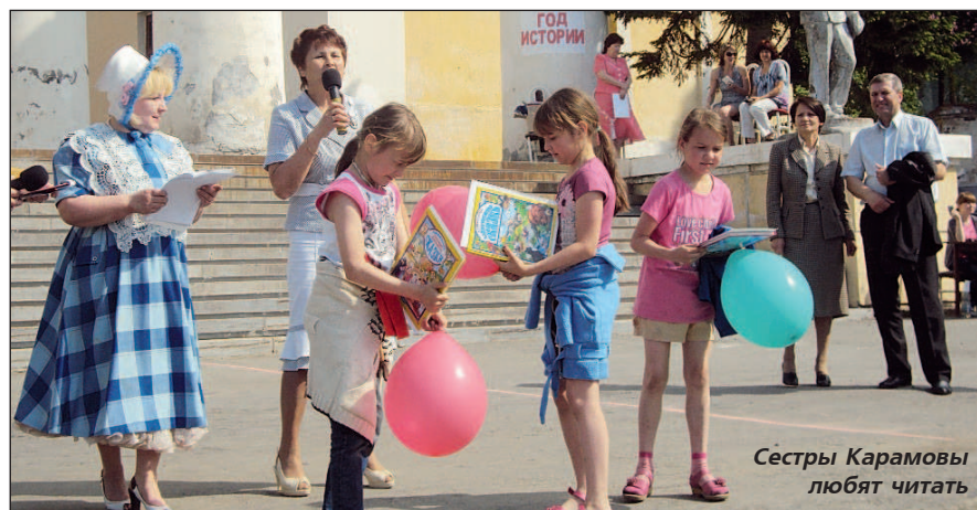
Сестры Карамовы любят читать