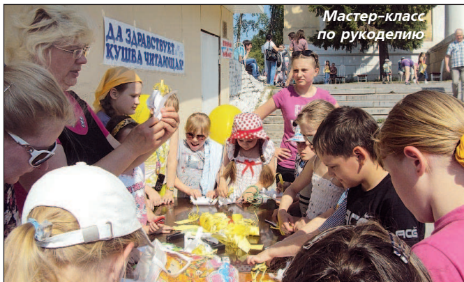
Мастер-класс по рукоделию