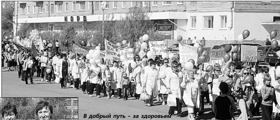
В добрый путь - за здоровьем

НЕОБЫЧНАЯ акция прошла в нашем городе в прошедшую субботу, 19 мая, по инициативе городской администрации и медиков. Десятки кушвинцев собрались с утра у здания администрации. Здесь были представители предприятий, учреждений города, учителя, школьники, а в первых рядах – медицинские работники. Плакаты с призывами отказаться от наркотиков и курения, утверждения, что спорт продлевает жизнь и другие, разноцветные флаги, воздушные шары, веселая музыка – все это создавало праздничное, приподнятое настроение.