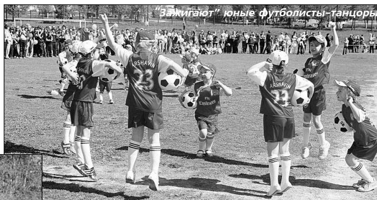
"Зажигают" юные футболисты-танцоры