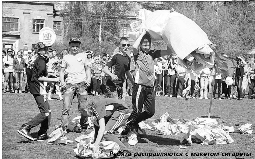
Ребята расправляются с макетом сигареты