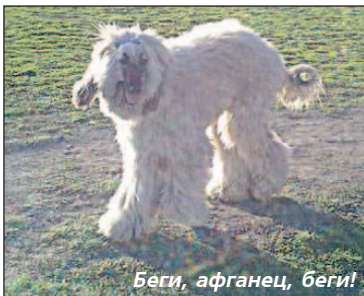
Беги, афганец, беги!

Дорогие товарищи! Если вашей собаке 9 месяцев, и она, по вашим словам, "маленькая", это не дает вам право снять её с поводка и выгуливать без