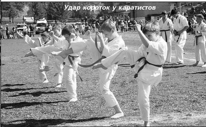
Удар короток у каратистов

ВСЕМ, кто ратует за здоровый образ жизни, а это они собрались на площади Советов, предстояло пройти 3000 шагов по маршруту: ул. Строителей, Союзов, Свободы, Луначарского до стадиона "Горняк". Желаящих удлиннить свою жизнь собралось так много, что когда первые ряды подошли к повороту на ул. Союзов, последние участники шествия только покидали площадь.