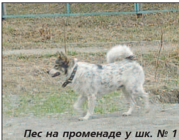
Пес на променаде у шк. № 1

намордника. Прежде чем завести собаку, подумайте: где и как вы её будете выгуливать и что для этого необходимо?