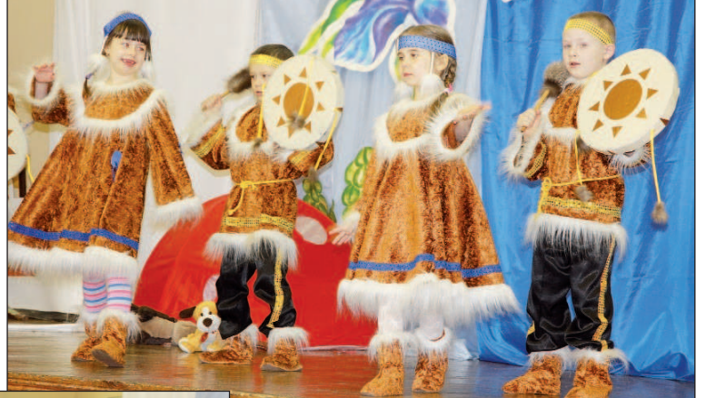
Сказка "Теремок" (детсад № 62)