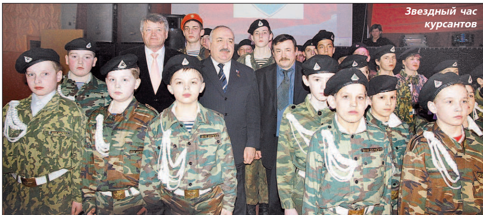
Звездный час курсантов

они "сразили" зрителей "кремлевским квадратом", чеканя строевые приемы с оружием. Но не только в этом упражнении курсанты клуба показали хорошую физическую подготовку, дух единства, сотрудничества и взаимопомощи. Они владеют приемами рукопашного боя, каратэ, с закрытыми глазами собирают и разбирают автомат, отлично вальсируют... Звездный час ВПК "Беркут-Спасатель" вылился в яркий трехчасовой рассказ о том, как из мальчишек вырастают настоящие мужчины, если их ведут мудрые наставники.