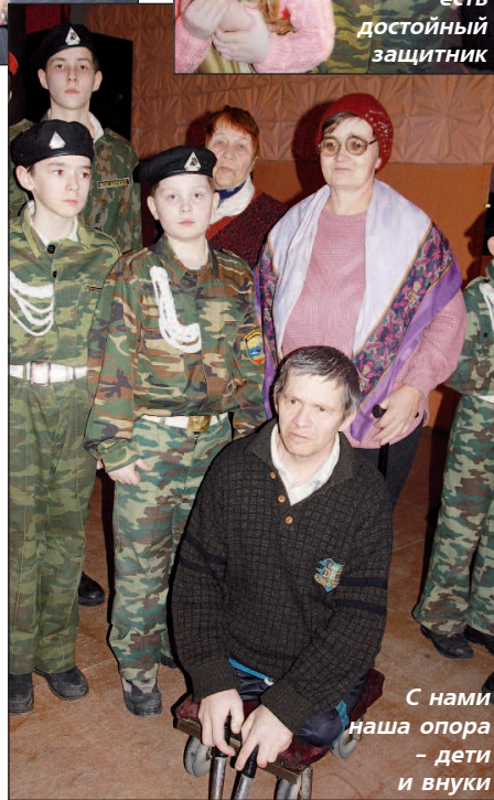
С нами наша опора – дети и внуки