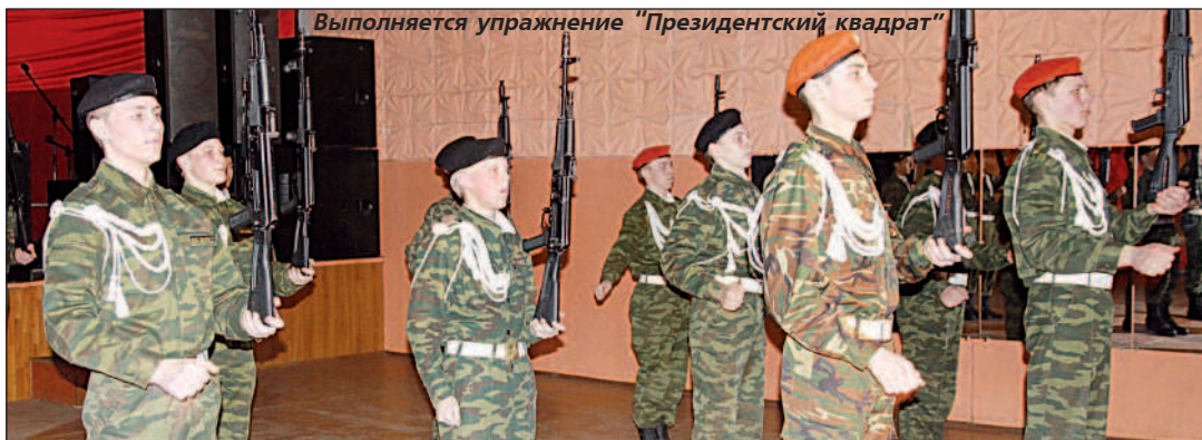
Выполняется упражнение "Президентский квадрат"