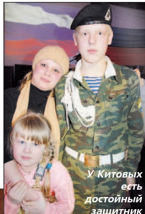
У Китовых есть достойный защитник