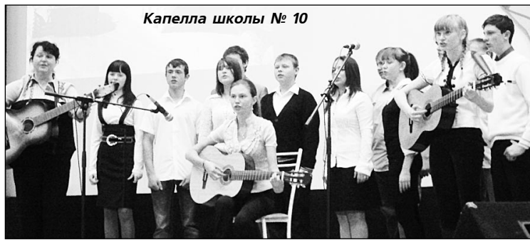
Капелла школы № 10