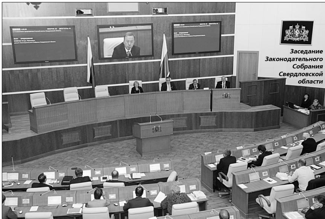
Заседание Законодательного Собрания Свердловской области

В НЕСЕНЫ изменения в областной закон "Об оказании в Свердловской области государственной социальной помощи малоимущим семьям, малоимущим одиноко проживающим гражданам, реабилитированным лицам и лицам, признанным пострадавшими от политических репрессий".