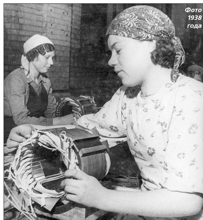
Фото 1938 года

ЦЕНТР ИНФОРМАЦИОННЫХ ТЕХНОЛОГИЙ Г.Кушва, ул. Свободы, 11. Тел.: 906-815-99-00