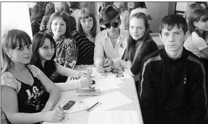
О молодежном форуме "Чтобы жить" читайте в следующем номере "КР".

Военкомат сообщает, что медицинская комиссия и комиссия по первоначальной постановке в пос. Баранчинском начнут работу 25 января.