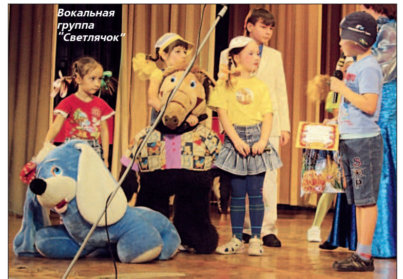
Вокальная группа "Светлячок"