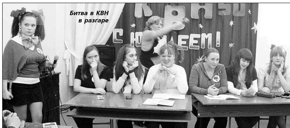
Битва в КВН в разгаре

Смехом и аплодисментами встречал зал каждое выступление. Особенно повеселили ребята из команд "Клёвые повара" и "Девчата". В музыкальном конкур-