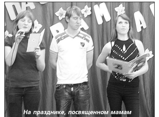
На празднике, посвященном мамам