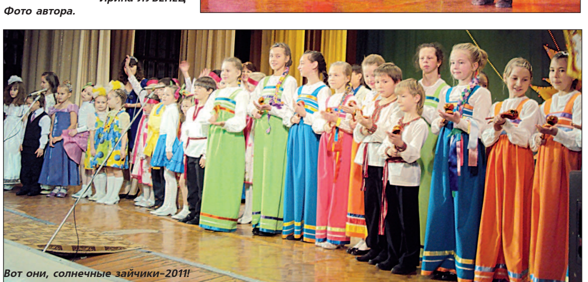
Вот они, солнечные зайчики-2011!