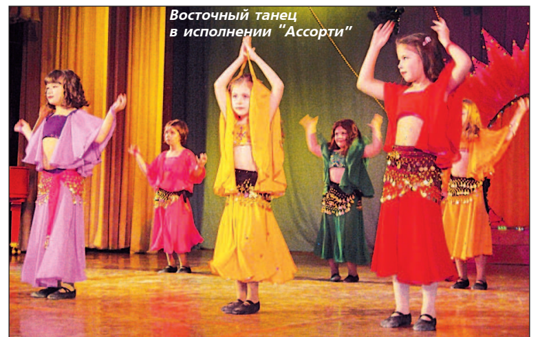
Восточный танец в исполнении "Ассорти"