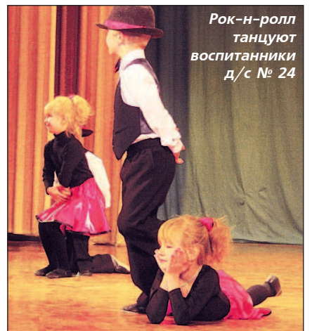
Рок-н-ролл танцуют воспитанники д/с № 24