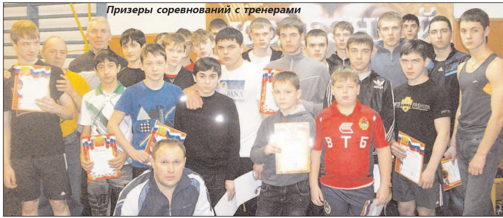
Призеры соревнований с тренерами

11 ДЕКАБРЯ в СК "Горняк" прошло первенство города по жиму штанги среди младших и старших юношей. Лично-командные соревнования проводились по правилам международной федерации AWPC. В них приняли участие 43 человека, поэтому соревнования проходили в 2 потока.