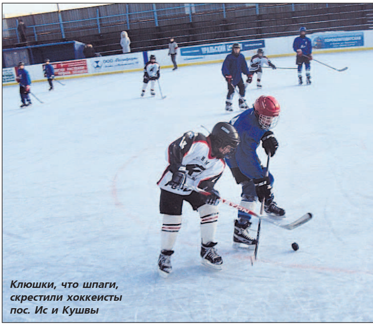
Клюшки, что шпаги, скрестили хоккеисты пос. Ис и Кушвы