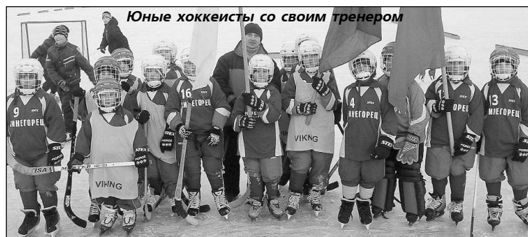
Юные хоккеисты со своим тренером

По окончании матча взрослой команды на ледовом поле появились маленькие хоккеисты с флагами и, сделал круг поче-