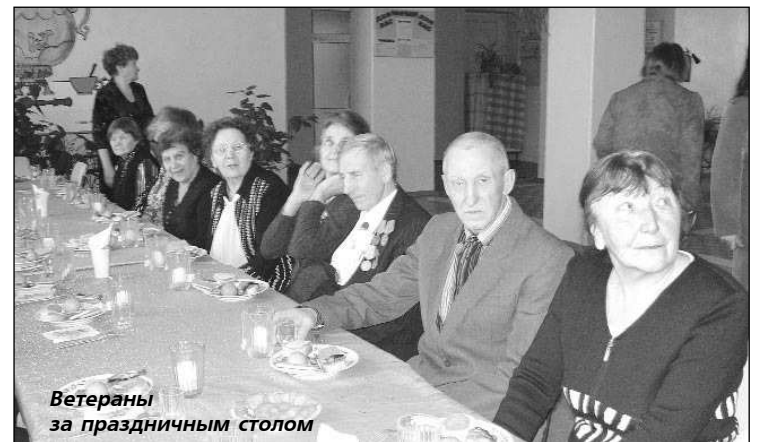
Ветераны за праздничным столом