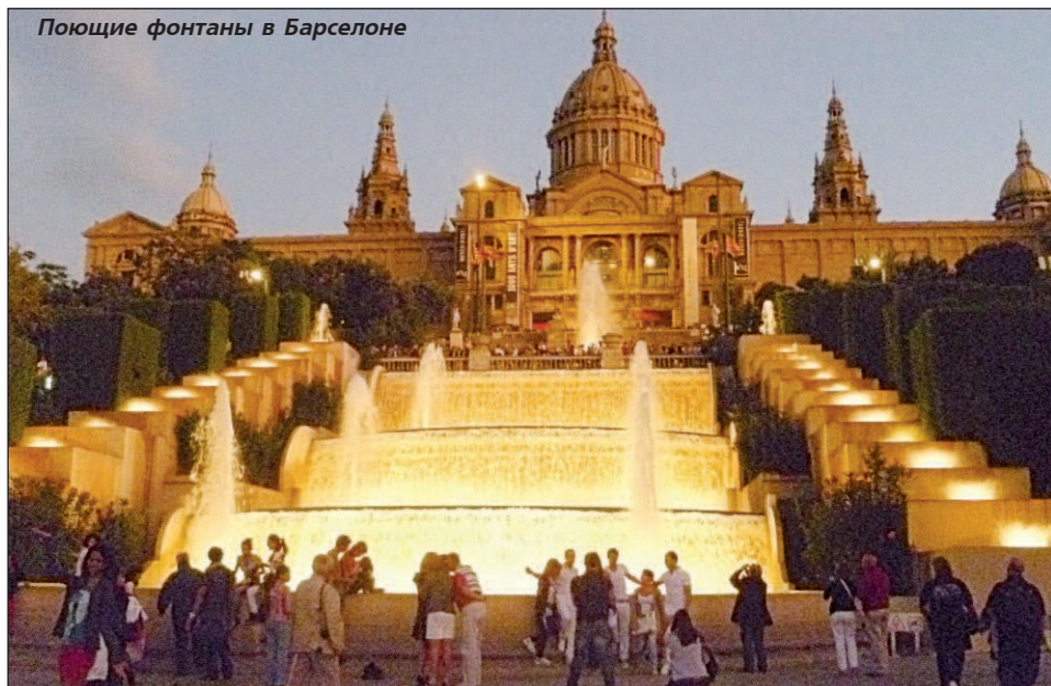
Поющие фонтаны в Барселоне