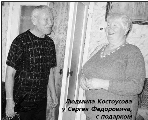
Идет декада инвалидов, которая открылась 1 декабря традиционным праздником для людей с ограниченными возможностями здоровья "Мир дому твоему".