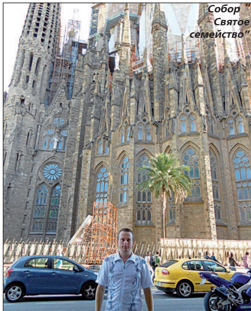
Собор "Святое семейство"

КОГДА в разгаре поздней осени или зимы в толпе прохожих замечаю загорелое лицо, меня невольно накрывает чувство белой зависти: этот человек вернулся с юга! Дома холод, метели, сугробы, а он, словно в раю, нежилась на песчаном пляже и купался в теплом бирюзовом море.