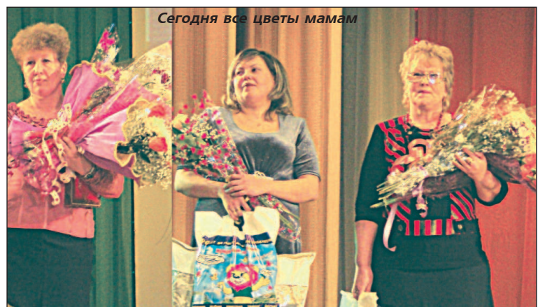
Сегодня все цветы мамам