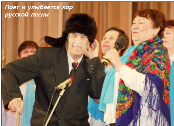
Поет и улыбается хор русской песни