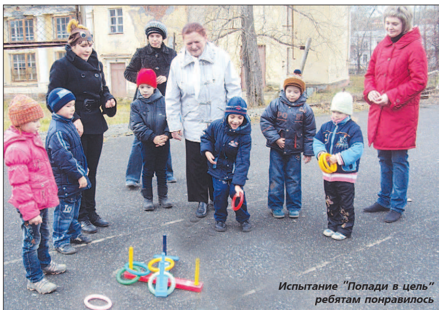
Испытание "Попади в цель" ребятам понравилось