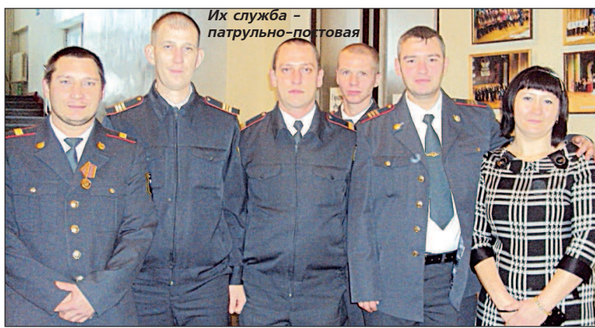
Их служба - патрульно-постовая