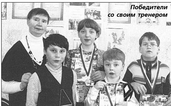
Победители со своим тренером

В младшей группе (возраст 9-11 лет) борьба была настолько напряженной и интересной, что результат трудно было