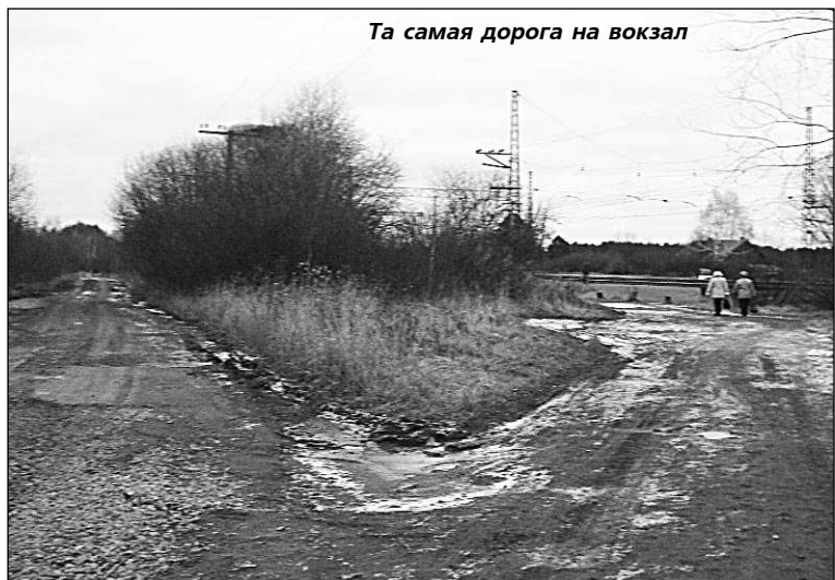
Та самая дорога на вокзал