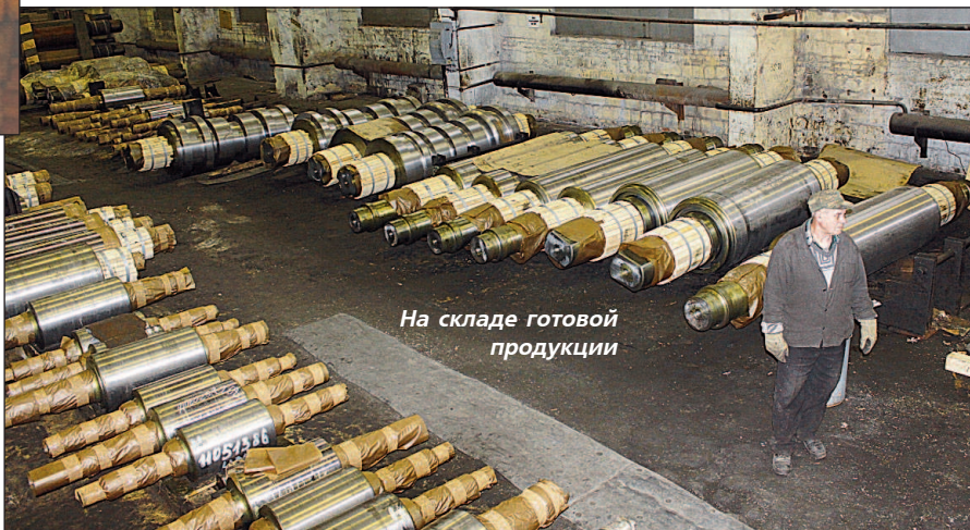
На складе готовой продукции

Недавно мы освоили обработку валков с высоким содержанием хрома. Они используются на листопрокатных станах и по стойкости значительно лучше, чем те,