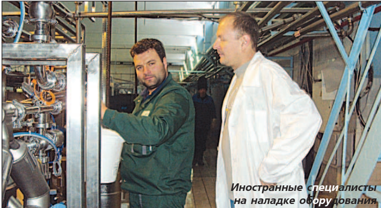
Иностранные специалисты наладке оборудования