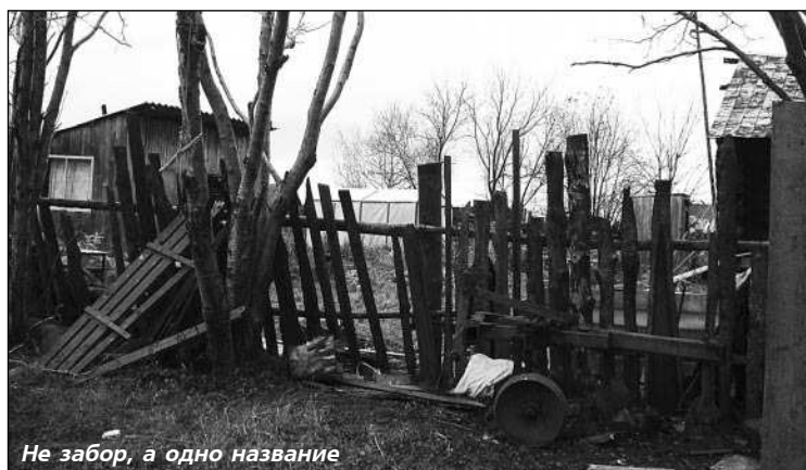
Не забор, а одно название

Как мы узнали, специальных мест для выгула скота в поселке не отведено, значит, и штраф наложить нельзя. Все сводится к тому, что для сохранности своего урожая надо ставить добротный забор. К примеру, так поступают владельцы садоводческих участков. Соседские разногласия разрешаемы, только надо постараться услышать друг друга.