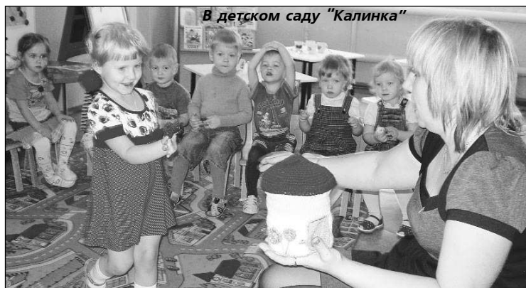
В детском саду "Калинка"

ВНАЧАЛЕ прошлой недели в Баранчинском стартовал отопительный сезон. Как никогда тяжело нынче проходил пуск тепла, да и сегодня, не все еще жилые дома отогрелись из-за возникающих проблем со стояками.