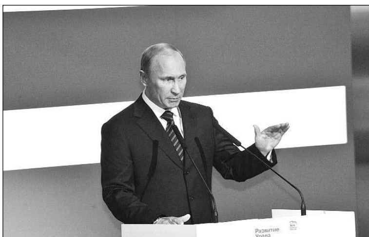
На конференции "Единой России" в Екатеринбурге в июне Владимир ПУТИН отметил: "Нам нужна, действительно, Народная программа, разработанная при самом непосредственном участии гражданского общества. Только тогда мы с вами сможем, действительно, опереться на неё и "с открытым забралом" защищать все её положения".

– Пожалуй, общим для всех трех частей программы – общенациональной, региональной и местной – является вопрос создания новых рабочих мест. Но не просто рабочих мест, а современного, высокотехнологичного производства, с которым наша страна избавилась бы от сырьевой зависимости, а люди могли бы получать достойную заработную плату. Как человек,