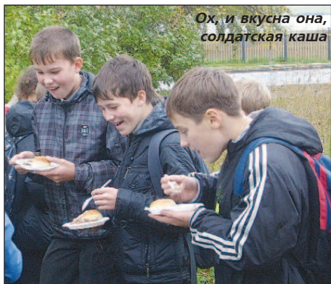
Ох, и вкусна она, солдатская каша

он скрыл от медкомиссии этот факт, а шрам объяснил тем, что порезался во время покоса, подлезая под стог. В армии он наравне со всеми осваивал боевую науку, и был счастлив. И только через полтора службы его все-таки комиссовали.