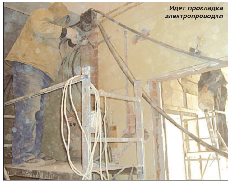
Идет прокладка электропроводки

В КОНЦЕ августа впервые за время, прошедшее со времен Великой Отечественной войны, в Саратове прошли памятные мероприятия, посвященные трагической дате в судьбе российских немцев – 70-летию со дня издания Указа Президиума Верховного Совета СССР "О переселении немцев, проживающих в районах Поволжья". На центральной площади г.Энгельса Саратовской области в торжественной обстановке был открыт памятник жертвам депортации немцев Поволжья.