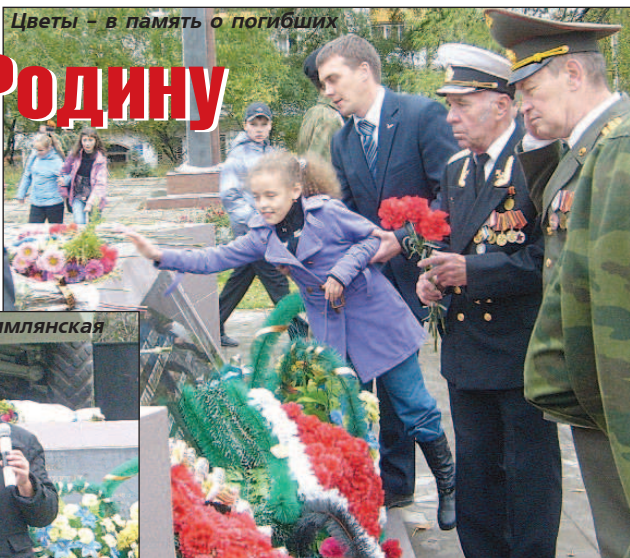
Цветы – в память о погибших

Мое поколение не испытало тягот войны. О тех страшных событиях мы узнавали из рассказов своих дедов, из книг, кинофильмов. Мы на этом воспитывались. И велико было уважение к военным, к службе в армии, желание быть полезным Родине. Хочу рассказать о своем двоюродном брате. Он должен был призываться в армию. Но перед этим перенес серьезную операцию – ему удалили часть легкого, и, конечно же, в армию после этого ему было нельзя. Однако желание служить было так велико, что