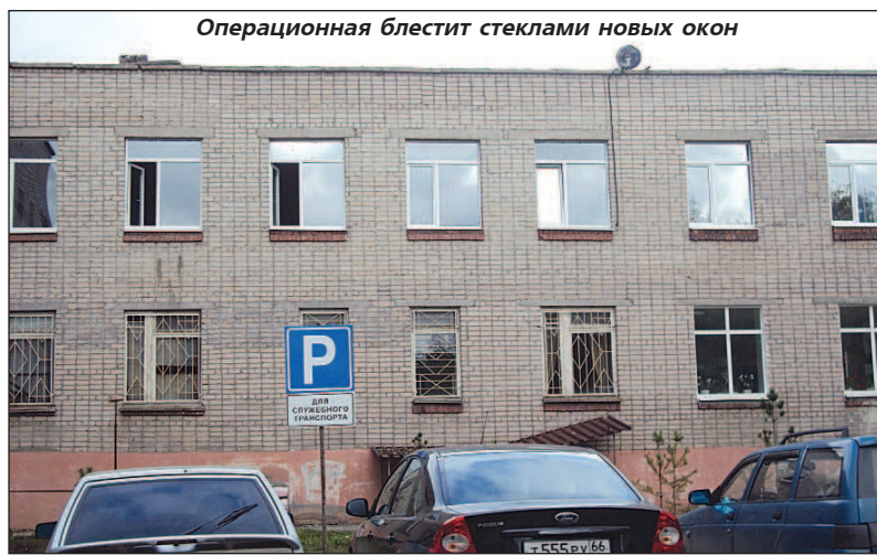
Операционная блещит стеклами новых окон