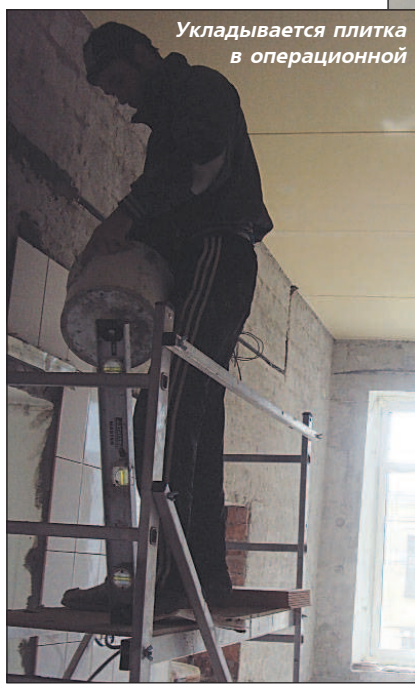
Укладывается плитка в операционной