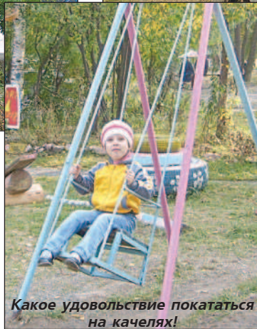
Какое удовольствие покататься на качелях!

ЕЩЕ ОДНА детская площадка, сделанная руками жителей, появилась этим летом в нашем городе. Во дворе между домами №11 и 13 по ул. Союзов теперь каждый день слышны детские голоса.