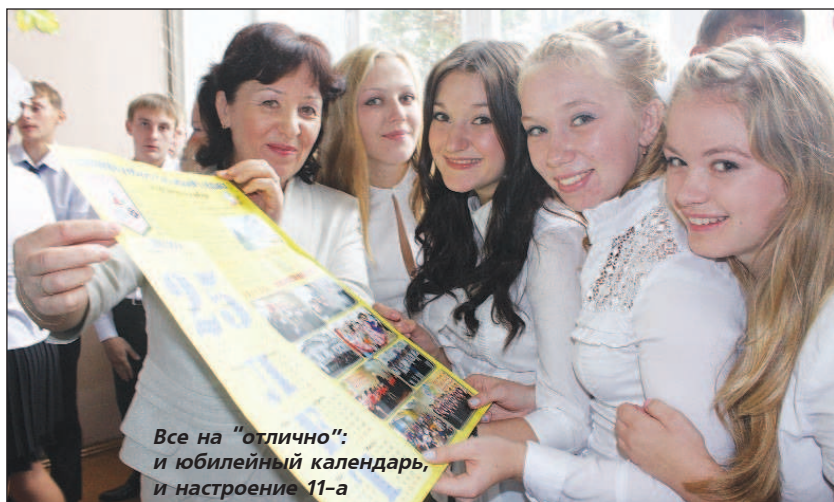
Все на "отлично": и юбилейный календарь, и настроение 11-а