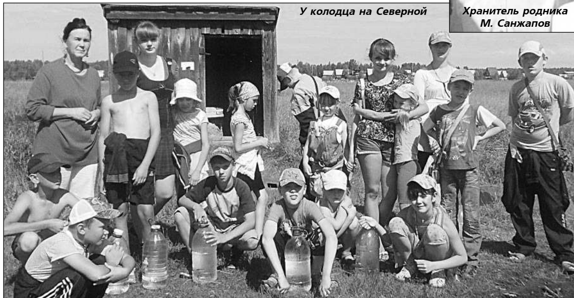
У колодца на Северной

Проблема чистой питьевой воды в поселке как была, так и остается. Несмотря на новую технологию водоочистки, внедренную на водозаборе прошлой зимой, многие баранчинцы перестраховываются и продолжают использовать воду из под крана только на хозяйственные нужды, а для питья и готовки пищи предпочитают родниковую воду.