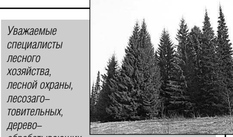
Уважаемые специалисты лесного хозяйства, лесной охраны, лесозаготовительных, деревообрабатывающих предприятий, ветераны лесопромышленного комплекса, поздравляю вас с профессиональным праздником.

05.15 «СОБЫТИЯ. ИТОГИ». 06.20, 18.10, 00.10, 03.50 «ПАТРУЛЬНЫЙ УЧАСТОК». 07.00 «ХОРОШЕЕ НАСТРОЕНИЕ». 09.00, 10.00, 11.00, 12.00, 13.00, 14.00, 15.00, 16.00, 17.00, 18.00, 19.00 «СОБЫТИЯ. КАЖДЫЙ ЧАС». 09.10 «НЮВЕЛИРНАЯ ПРОГРАММА». 09.30 «ВЕСТИНИ ЕВРАЗИЙСКОЙ МОЛОДЕЖИ». 10.20 «ДЕЙСТВУЮЩИЕ ЛИЦА». 11.10 «ГУРМЭ». 11.40 «ПРОКУРАТУРА. НА СТРАЖЕ ЗАКОНА». 12.30 «СОБЫТИЯ. АКЦЕНТ». 13.10 «ПОЛИТКЛУБ». 14.05 ДОКУМ. ФИЛЬМ 15.05 «ПРЯМАЯ ЛИНИЯ. ЖКХ». 15.35 «КОМУ ОТЛИЧНЫЙ РЕМОНТ?!». 16.05 ДОКУМ. ФИЛЬМ 17.10 «ДЕПУТАТСКОЕ РАССЛЕДОВАНИЕ». 17.30 «РЕЦЕПТ». 19.15 ДОКУМ. ФИЛЬМ 20.00, 23.00, 01.20, 04.10 «СОБЫТИЯ. ИТОГИ». 20.30, 03.20 «ПРЯМАЯ ЛИНИЯ. ТРУДОВЫЕ ОТНОШЕНИЯ». 21.00, 02.20 НОВОСТИ ТАУ. 22.00 Т/с «ГАЛИНА». 23.40 «СОБЫТИЯ УРФО». 00.55 «ЗАЧЕТНАЯ НЕДЕЛЯ».