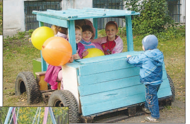
В веселое будущее "мчит" ребят дворцовый внедорожник