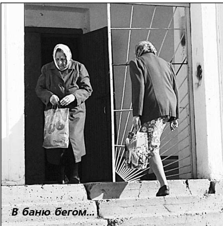
В баню бегом...