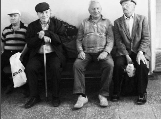
В очереди за парком