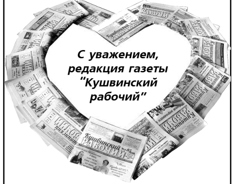
С уважением, редакция газеты "Кушвинский рабочий"

БЛАГОДАРИМ руководителей этих организаций за теплый при- ем наших читателей, которые каждую неделю приходят за све- жим номером газеты. Принимаются коллективные заявки на подписку в редакции от предприятий, организаций, жителей.