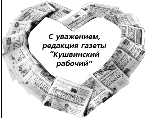
С уважением, редакция газеты "Кушвинский рабочий"

БЛАГОДАРИМ руководителей этих организаций за теплый прием наших читателей, которые каждую неделю приходят за свежим номером газеты. Принимаются коллективные заявки на подписку в редакции от предприятий, организаций, жителей.