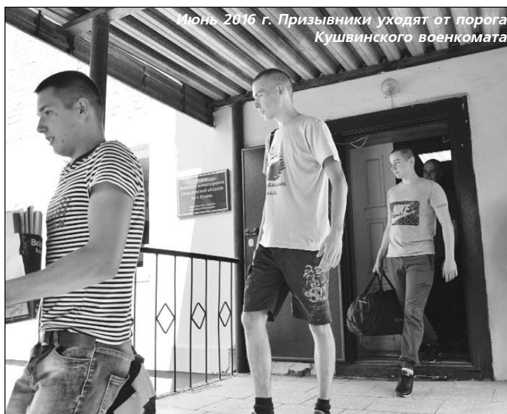
Июнь 2016 г. Призывники уходят от порога Кушвинского военкомата