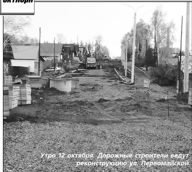
Утро 12 октября. Дорожные строители ведут реконструкцию ул. Первомайской.

УВАЖАЕМЫЕ ветераны и работники предприятий дорожного хозяйства Горнозаводского управленческого округа! Примите поздравления с вашим профессиональным праздником!