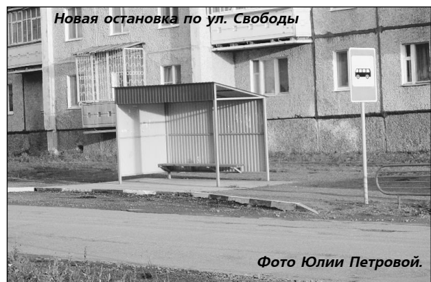
Новая остановка по ул. Свободы

- Уже подписаны все разрешительные документы, есть решение комиссии по транспортному сообщению. Пока по этой улице будет ходить маршрут №3 "пос. Восток - пос. Дачный". Дело за перевозчиком, он должен внести изменения в паспорт маршрута, после этого выйдет постановление главы КГО об изменении автобусного маршрута и автобусы пойдут.