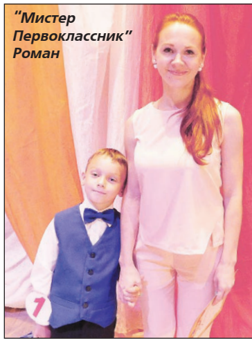
"Мистер Первоклассник" Роман