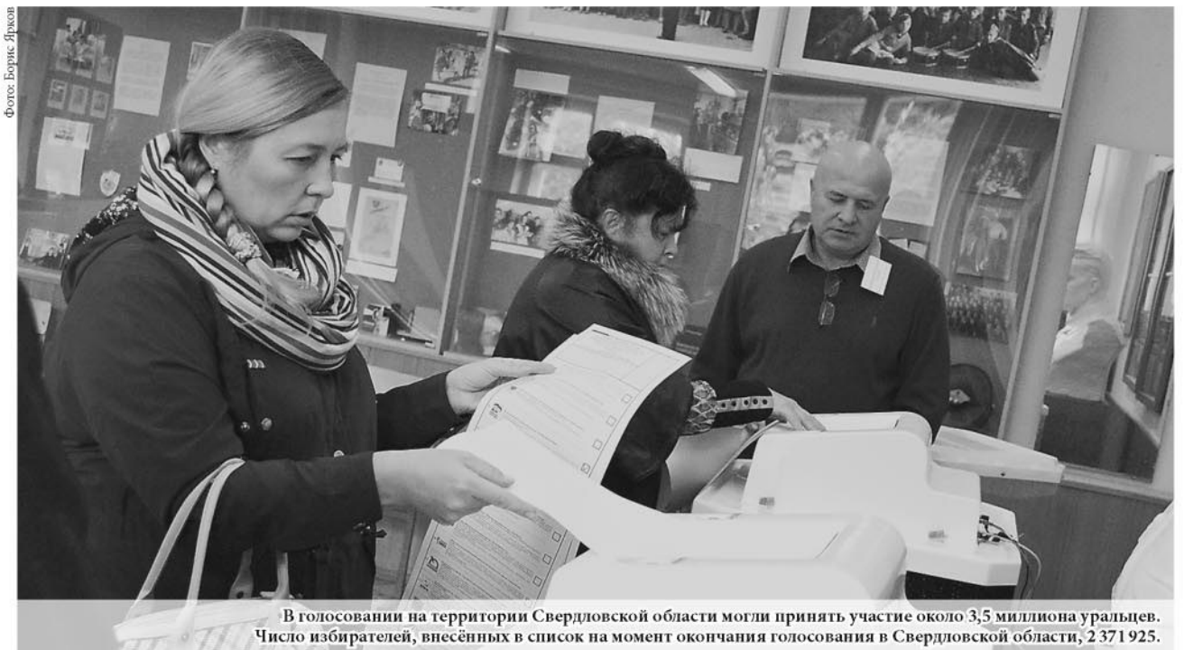
В голосовании на территории Свердловской области могли принять участие около 3,5 миллиона уральцев. Число избирателей, внесённых в список на момент окончания голосования в Свердловской области, 2 371 925.

Ранее Президент РФ Владимир Путин заявил, что выборы показали растущую политическую зрелость россиян, которые своим волеизъявлением продемонстрировали стремление к стабильной и надёжной ситуации в стране. Глава государства призвал будущих парламентариев от «Единой России» сотрудничать с другими фракциями и искать решения, которые будут приниматься всем обществом.