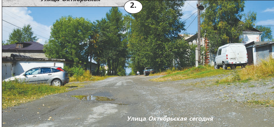
Улица Октябрьская сегодня

На одной из фотографий изображена улица, которую сразу не найдешь на современной карте Кушвы, не указана она на картах в интернете: улица Октябрьская. Сейчас на ней расположен отдел кадров КЗПВ и