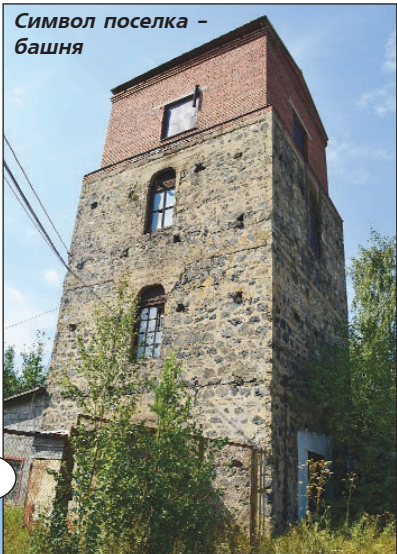
Символ поселка - башня