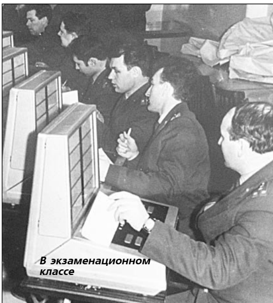
В экзаменационном классе