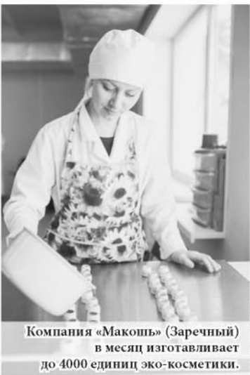
Компания «Макошь» (Заречный) в месяц изготавливает до 4000 единиц эко-косметики.

Получить инвесткредиты смогут также предприниматели из таких приоритетных отраслей, как производство товаров, переработка сельхозпродукции, гостиничный бизнес, инновационные предприятия.