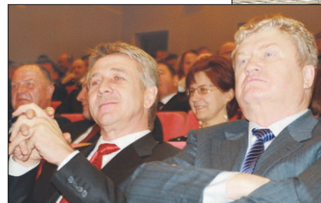
Фотографией В. А. Гвоздикова занимается уже 55 лет, он участник многих городских, областных и всесоюзных фотовыставок. Недав-

но им издан фотоальбом "История края в лицах" и набор фотографий к 280-летию Кушвы. На этой выставке он представил избранные фотографии, на которых запечатлены известные политики, президенты страны, рабочие, пейзажи родного Урала. Всего на выставке выставлено 26 фоторабот большого формата. Фотовыставка посвящена предстоящему юбилею автора.