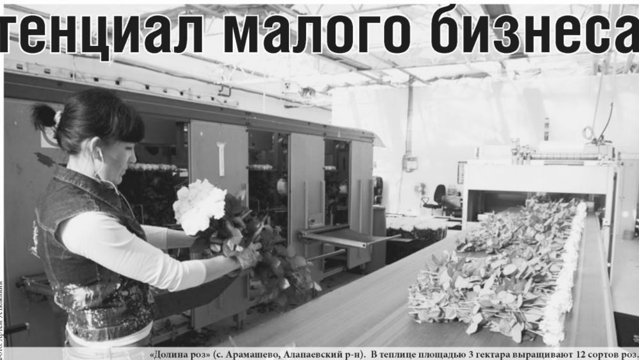
«Долина роз» (с. Арамашево, Алапаевский р-н). В теплице площадью 3 гектара выращивают 12 сортов роз.

Малый и средний бизнес отметил в конце мая свой профессиональный праздник – День предпринимателя. По мнению губернатора Евгения Куйвашева, деловая инициатива в Свердловской области развивается высокими темпами. В рамках поддержки малого и среднего предпринимательства проводятся обучающие программы, начинающим предоставляются гранты для реализации бизнес-проектов, тем, кто занят в реальном секторе экономики, выделяются субсидии на модернизацию оборудования. Всё это вносит весомый вклад в решение социально-экономических задач региона, улучшение делового климата, повышение устойчивости экономики.