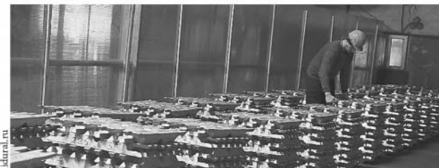
Завод алюминиевых сплавов (п. Монетный). Алюминиевые чушки поставляются на мировые концерны в Японию, Германию, США и другие страны.

...Под таким названием в рамках празднования Дня российского предпринимательства в Доме журналистов открылась фотовыставка уральских предприятий.