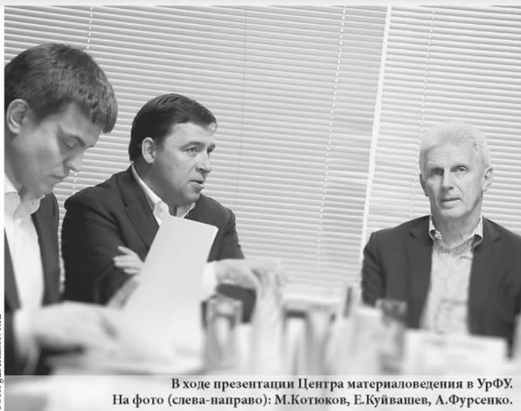
В ходе презентации Центра материаловедения в УрФУ. На фото (слева-направо): М.Котюков, Е.Куйвашев, А.Фурсенко.

По уровню развития образования и науки, с точки зрения технической обеспеченности вузов, Средний Урал может конкурировать с самыми прогрессивными городами и регионами мира. Об этом помощник Президента России Андрей Фурсенко заявил губернатору Евгению Куйвашеву в ходе встречи, которая состоялась по итогам визита в Свердловскую область.