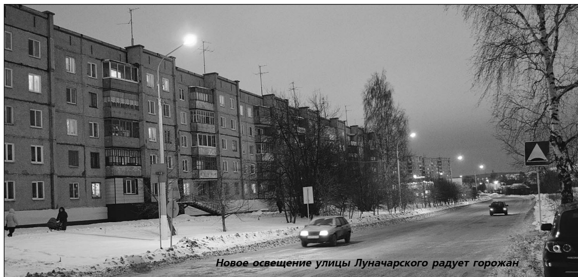
Новое освещение улицы Луначарского радует горожан

тельства только на 84,7 % и, соответственно, объем доходной базы не позволит обеспечить в полной мере исполнение действующих и принимаемых обязательств городского округа, которые направлены на выполнение вопросов местного значения".