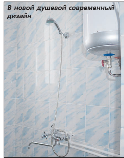
В новой душевой современный дизайн