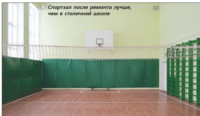
Спортзал после ремонта лучше, чем в столичной школе