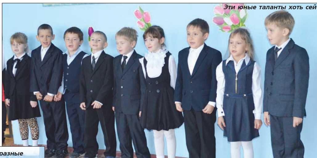
Эти юные таланты хоть сейчас в проект "Голос. Дети"