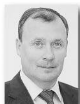
Алексей Орлов, первый заместитель председателя правительства Свердловской области – министр инвестиций и развития:

«Главное – всё, что мы обещаем людям, должно быть исполнено. Пасовать перед временными трудностями мы не будем, у нас достаточно сил, средств, политической воли, чтобы продолжать курс на сознательное развитие региона, достижение нового качества жизни уральцев».