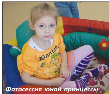
Фотосессия юной принцессы