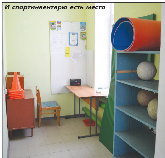
И спортивному есть место