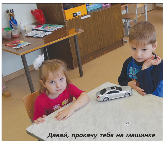
Давай, прокачу тебя на машинке