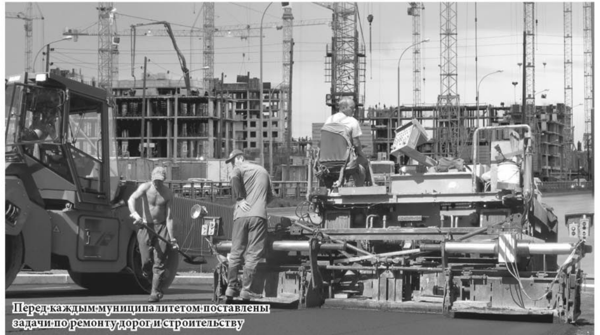
Перед каждым муниципалитетом поставлены задачи по ремонту дорог и строительству

«Это значит, что снижение доходного прогноза территорий при балансировке будет скомпенсировано из областного бюджета субсидиями и дотациями, – отметила министр финансов области Галина Кулаченко. – Кроме того, не совсем корректно сравнивать общую сумму заявленной потребности муниципалитетов с итоговой. Ведь еще на старте согласительных процедур мы договорились о том, что в сегодняшней экономической ситуации должны быть выделены и обоснованы самые основные проблемы, требующие дополнительного финансирования».