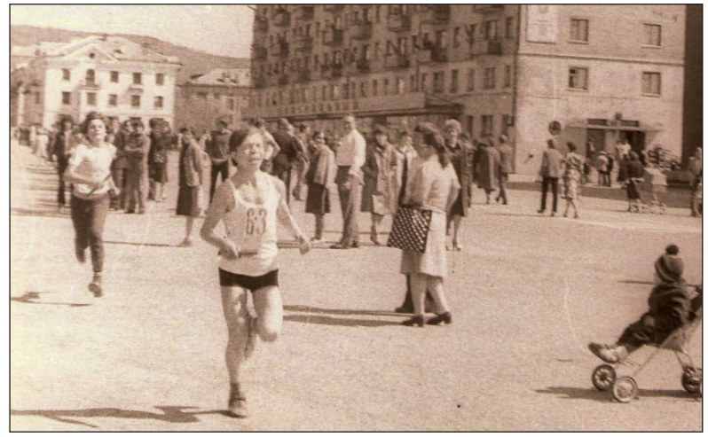
Фото из архива семьи Изотовых. 90 - е годы. Весна. Городская эстафета. Забег учеников общеобразовательных школ. Ссылка http://vk.com/club96139861