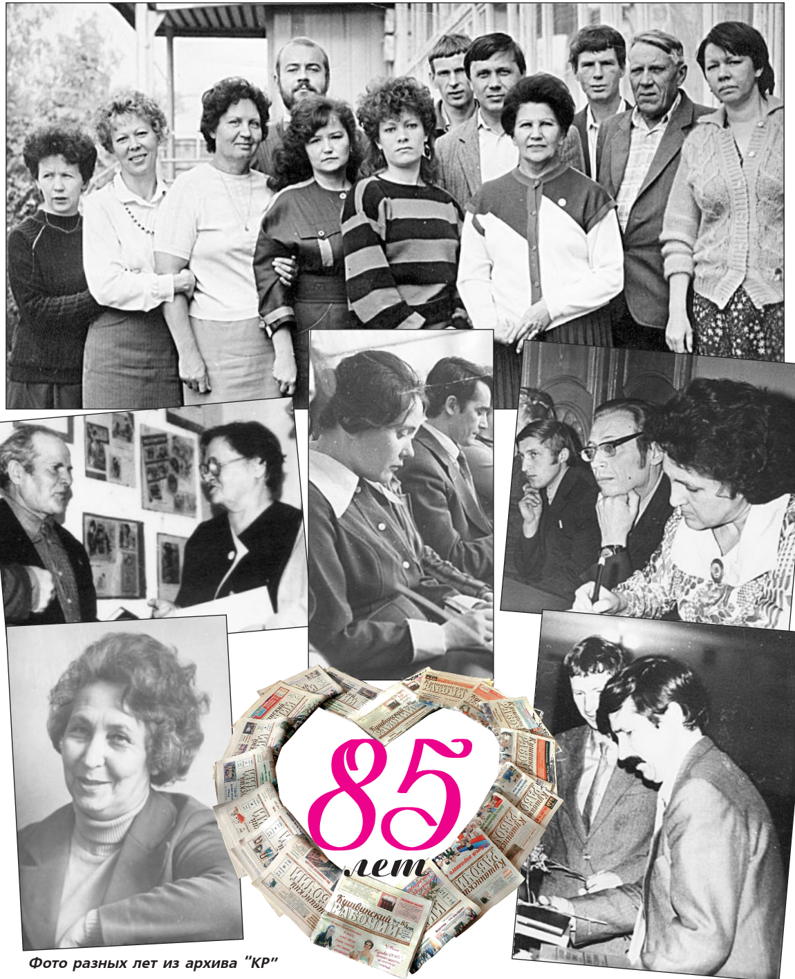
Фото разных лет из архива "КР"