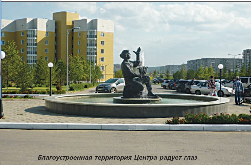
Благоустроенная территория Центра радует глаз