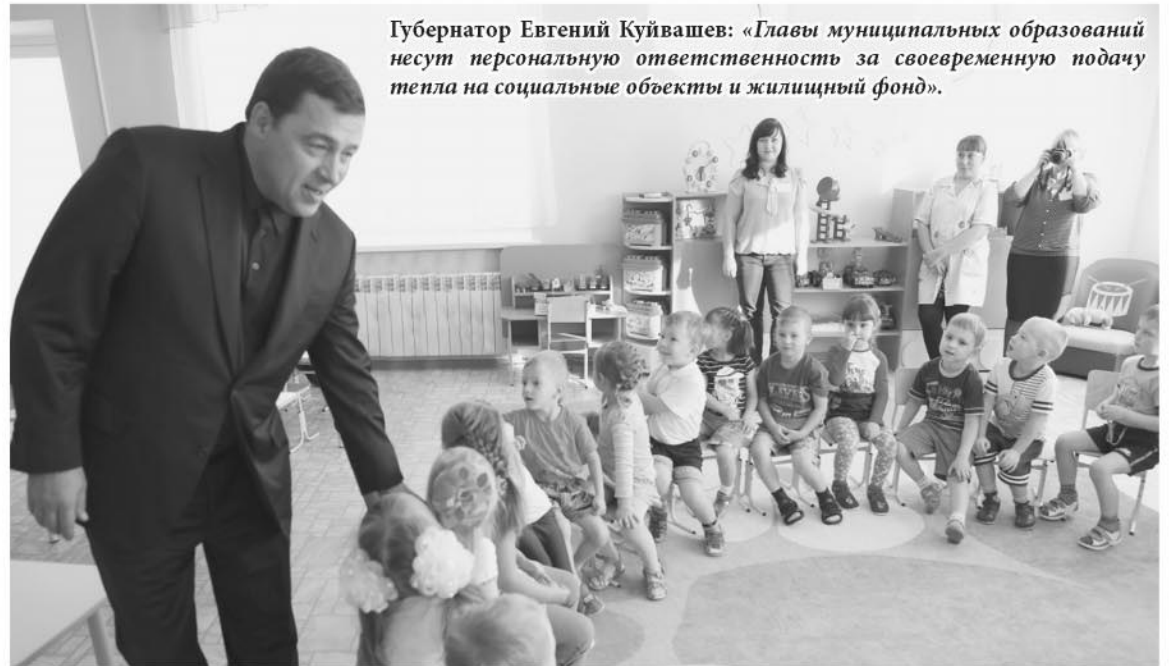
Губернатор Евгений Куйвашев: «Главы муниципальных образований несут персональную ответственность за своевременную подачу тепла на социальные объекты и жилищный фонд».

В осеннее ненастье семь погод на дворе. Так гласит старинная пословица. А потому сейчас, когда температура наружного воздуха несколько дней подряд не поднимается выше 8 градусов, местные власти всё больше озабочены своевременной подачей тепла. По оперативной информации регионального министерства энергетики и ЖКХ, по состоянию на 30 августа, в 17 муниципалитетах области готовность коммунальной инфраструктуры к зиме превысила 95%. С началом отопительного сезона первыми тепло получают учреждения социальной сферы: школы, больницы и детские сады, затем – объекты жилфонда. При этом все жилые дома должны быть учтены и готовы принять теплоресурс. Как заявил губернатор Евгений Куйвашев, к началу отопительного сезона в регионе не должно остаться ни одного «бесхозного» жилого дома.