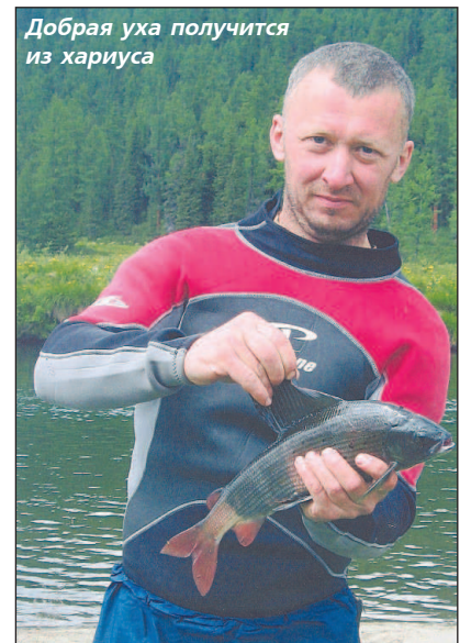
Добрая уха получится из хариуса