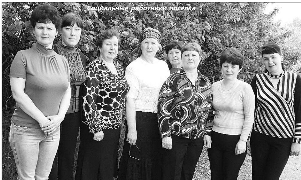
Социальные работники поселка

— В баранчинском отделении 10 участков, социальных работников тоже десять, их возраст от 30 до 60 лет. Со дня