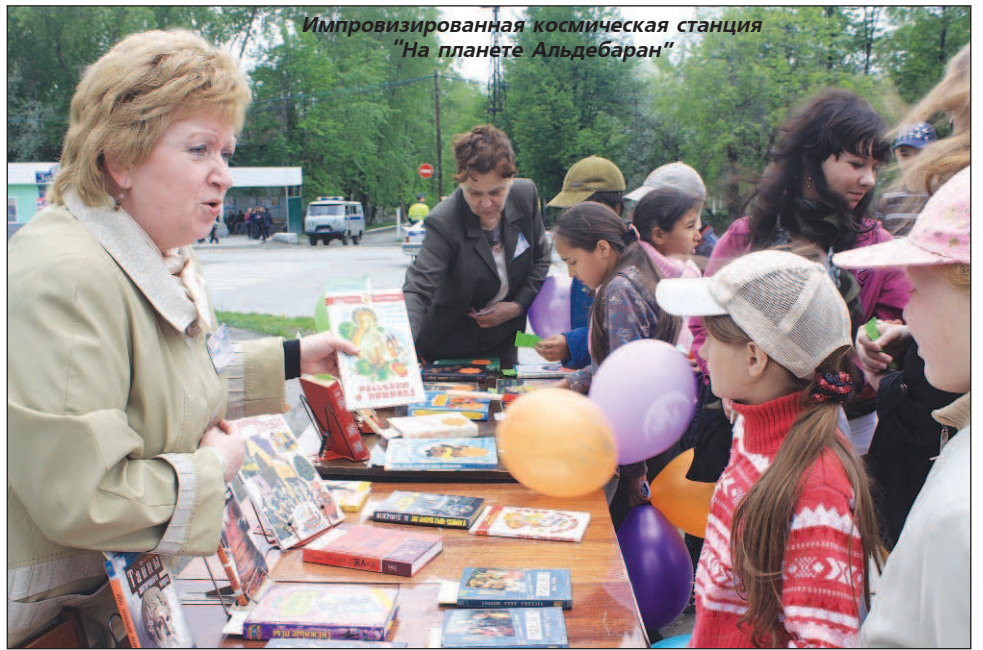
Импровизированная космическая станция "На планете Альдебаран"