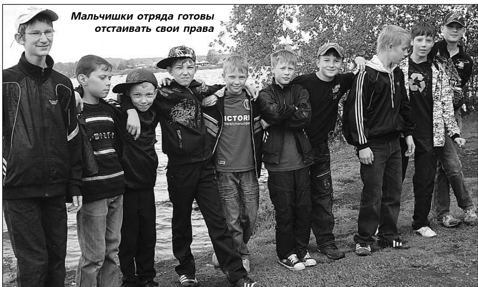
Мальчишки отряда готовы отстаивать свои права