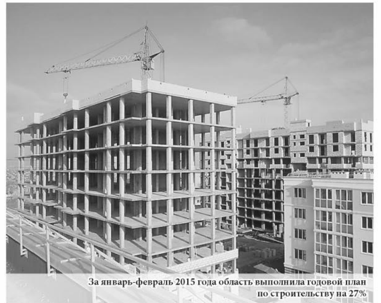
За январь-февраль 2015 года область выполнила годовой план по строительству на 27%

годового плана. Всего к концу года мы планируем построить 2,1 миллиона квадратных метров жилья. Но важно понимать, что сейчас сдаётся то, что начало возводиться в 2013 году – начале 2014 года. Поэтому сегодня мы должны делать задел на будущие периоды. Важно, чтобы застройщики не только работали над завершением имеющихся объектов, но и начинали новые проекты, которые будут сдаваться в 2016-2017 годах».