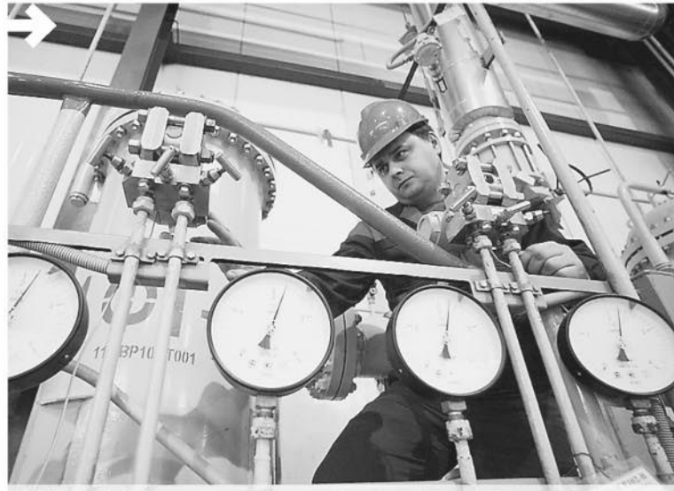
В сфере ЖКХ Свердловской области сейчас реализуются 75 инвестпроектов

«Наша стратегическая установка на мобилизацию экономического и общественного потенциала региона даёт свои результаты»