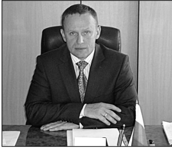
(Продолжение. Начало в "КР" № 13) Образование

Отметим, что социальная поддержка ветеранов в Свердловской области находится на личном контроле у губернатора Евгения Куйвашева, и является одним из приоритетов в реализации социальной политики региона.