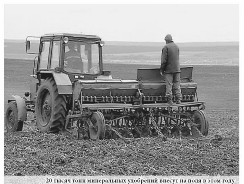
20 тысяч тонн минеральных удобрений вносят на поля в этом году

По последним данным министерства сельского хозяйства РФ, в южных районах страны посевная началась на 2 недели раньше. Мы не исключаем, что благодаря хорошей погоде и мы сможем выйти в поля раньше. А пока в рабочем порядке готовимся к кампании».