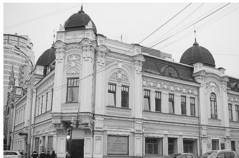
В Екатеринбурге это здание построено купцом Первущиным в начале XX века. В годы Великой Отечественной войны здесь работал прославленный радиодиктор Юрий Левитан. На здании установлена мемориальная доска.

залом и плавательным бассейном. На строительство ФОКа из регионального бюджета в 2014 году было выделено 50 миллионов рублей, в 2015 году – 67,4 миллиона рублей. В настоящее время решается вопрос о привлечении средств из федерального бюджета.