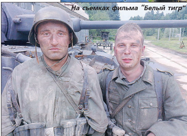
На съемках фильма "Белый тигр"