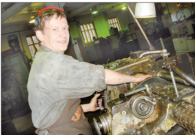
Трудом славен человек