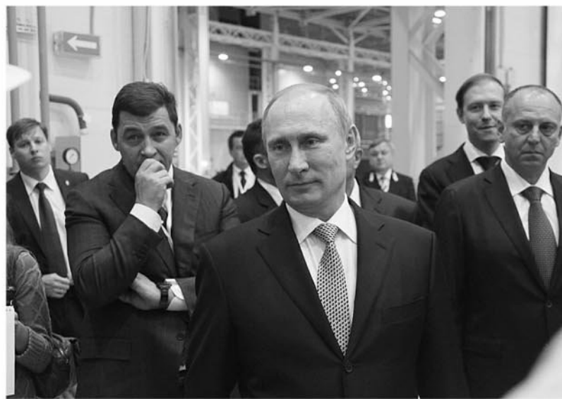
Президент Владимир Путин в сопровождении губернатора Евгения Куйвашева в завершение визита в Свердловскую область 11 ноября посетил завод «Уральские локомотивы» в Верхней Пышме, где в этот день был дан старт производству скоростных электропоездов «Ласточка».

Накануне финального марафона за право проведения «ЭКСПО 2020», на которое также претендуют Дубай (ОАЭ), Измир (Турция) и Сан-Паулу (Бразилия), главы двух государств Владимир Путин и Нурсултан Назарбаев дали высокую оценку Екатеринбургскому в ходе X Межрегионального форума сотрудничества России и Казахстана.