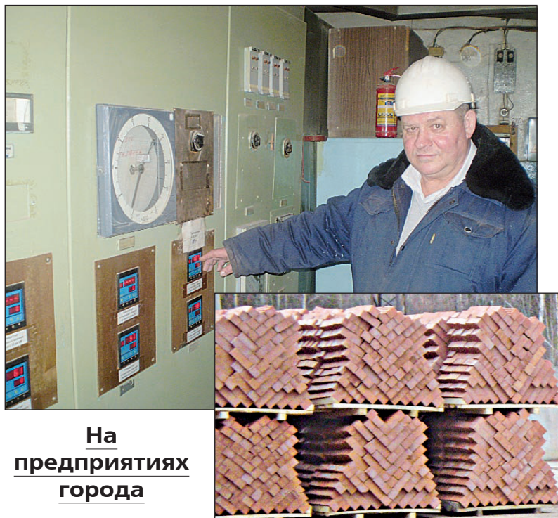
На предприятиях города

Здесь деньги не получают, здесь их зарабатывают