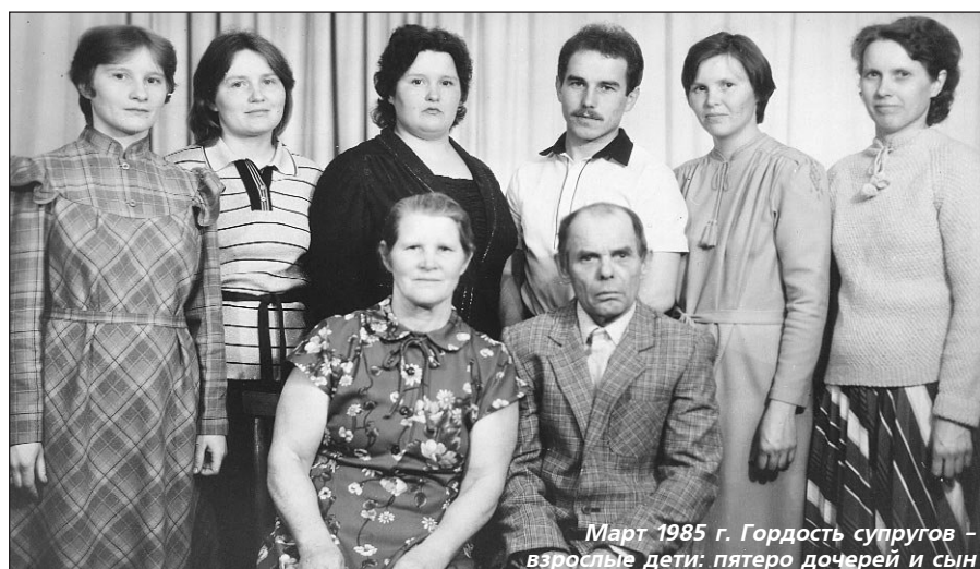
Март 1985 г. Гордость супругов - взрослые дети: пятеро дочерей и сын