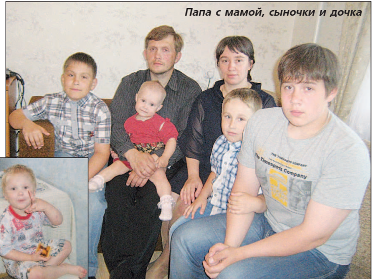
Папа с мамой, сыночки и дочка

Из этой семьи уходить не хотелось. Открытые, светлые, излучающие душевное тепло и положительную энергию жильцы трехкомнатной квартиры очаровали меня. Радость светилась в улыбках детей, добро и понимание сквозило во взгляде взрослых. Мы проговорили почти четыре часа. И что меня удивило - дети не досаждали нам, а играли в своих комнатах, не шумели, оберегая сон одного из братьев. Шутка ли в наше время растить пятерых детей. Как супруги решились на это? Что дает им силы? Может, эти еще молодые родители (матери 36 лет, отцу - 37) изобрели свою методику воспитания? Да и вообще: каково это быть мамой и папой многодетной семьи?