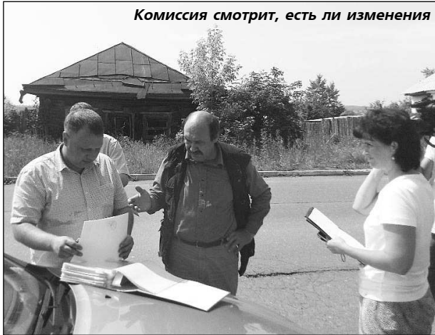
Комиссия смотрит, есть ли изменения

ПРОЕЗЖАЯ по нашему городу, видишь, как многие дома в частном секторе преобразуются: у одного дома появилась новая отделка, в другом – пластиковые окна, у третьего – новый забор. Но эту радостную картину портят ветхие дома, на невеселые мысли наводят и обгорелые останки бывших домовладений. Еще обиднее за родной город становится, когда лицезрешь наваленные у забора кучи щебенки, дрова и другие стройматериалы, а порой и опил у самого газопровода, которые лежат здесь годами, мешая прохожим, заставляя их выходить на дорогу. Частенько здесь же можно увидеть и склад сухих веток и деревьев. Мы не раз писали о том, что это недопустимо.