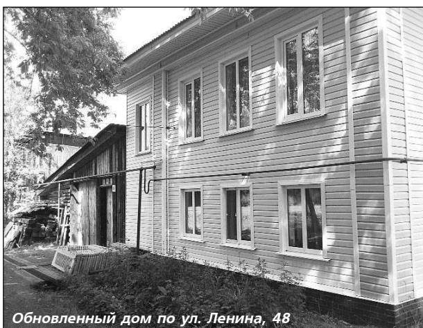
Обновленный дом по ул. Ленина, 48