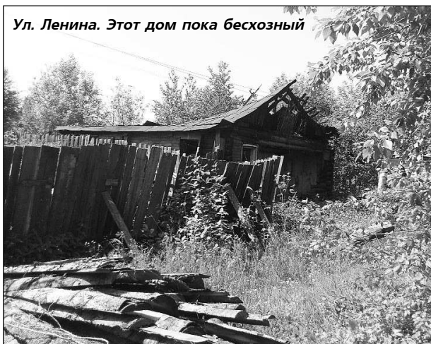
Ул. Ленина. Этот дом пока бесхозный

В КУШВИНСКОМ городском округе создана комиссия по комплексному обследованию улиц под председательством М. Слепухина, и.о. главы администрации КГО, в ее состав также вошли представители КУМИ, КЖКС, отделов архитектуры, по развитию потребительского рынка, дорожной инспекции ОГИБДД, участковой службы полиции, а также представители Кушвинского участка Облкоммунэнерго и газовых сетей, Госпожнадзора.