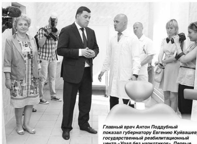
Главный врач Антон Поддубный показал губернатору Евгению Куйвашеву государственный реабилитационный центр «Урал без наркотиков». Первые пациенты - порядка 15 человек - начнут здесь лечение уже в июле.

«Мы обозначили цель при создании этого центра - победить одну из самых страшных бед человечества - наркоманию», - сказал Евгений Куйвашев .