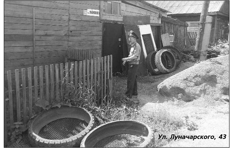
Ул. Луначарского, 43

ПРОЕЗЖАЯ по нашему городу, видишь, как многие дома в частном секторе преобразуются: у одного дома появилась новая отделка, в другом – пластиковые окна, у третьего – новый забор. Но эту радостную картину портят ветхие дома, на невеселые мысли наводят и обгорелые останки бывших домовладений. Еще обиднее за родной город становится, когда лицезрешь наваленные у забора кучи щебенки, дрова и другие стройматериалы, а порой и опил у самого газопровода, которые лежат здесь годами, мешая прохожим, заставляя их выходить на дорогу. Частенько здесь же можно увидеть и склад сухих веток и деревьев. Мы не раз писали о том, что это недопустимо.