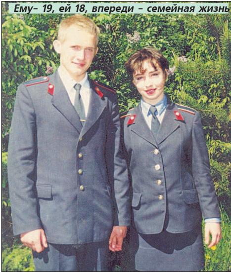
Ему - 19, ей 18, впереди - семейная жизнь